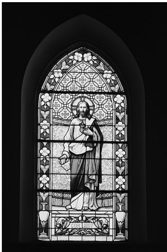
Baie 1 : Sacré-Coeur.