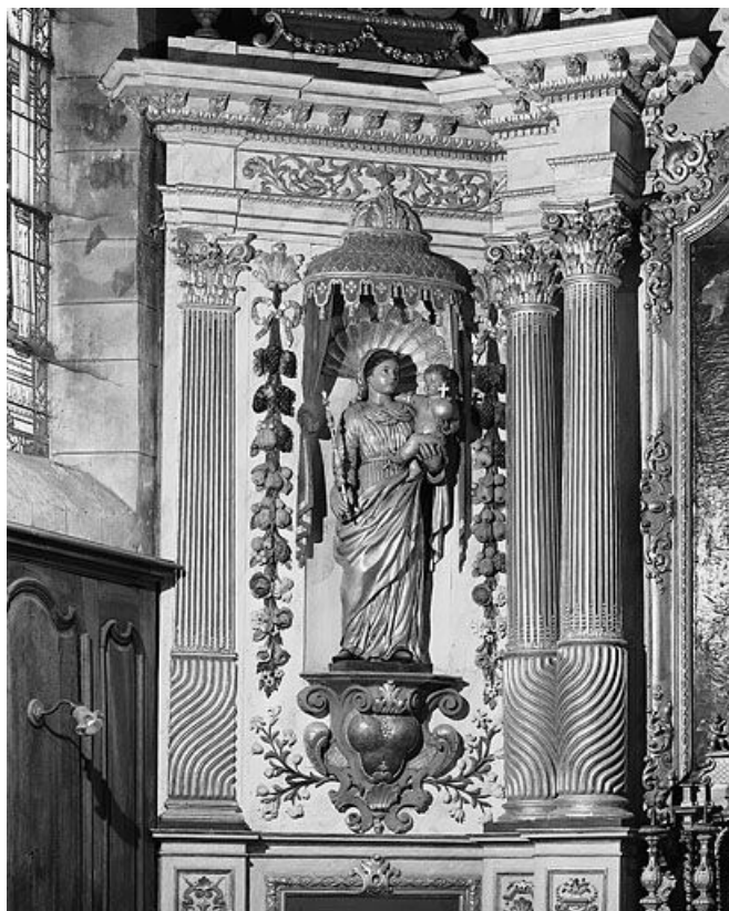
Vierge à l'Enfant.