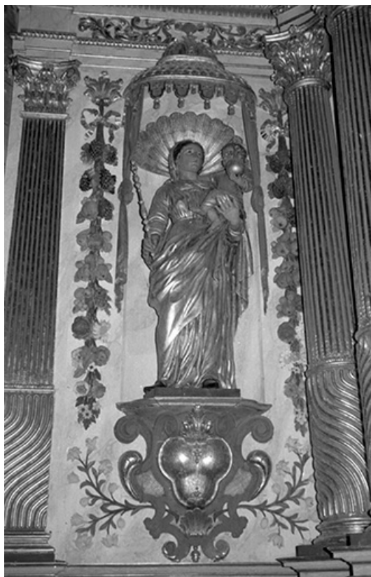
Vierge à l'Enfant.