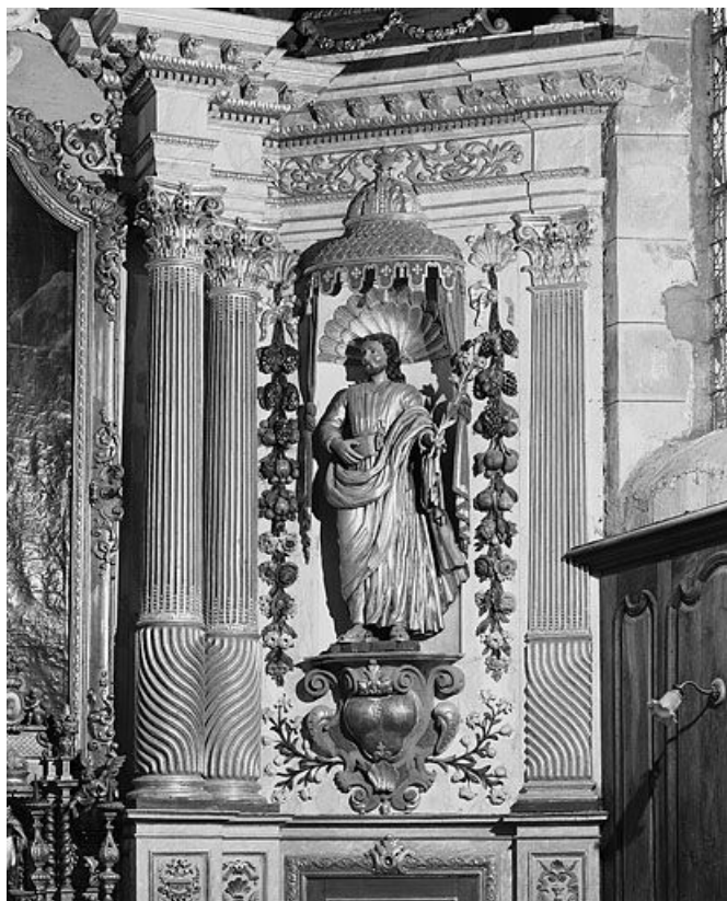
Saint Joseph. 25, Bannans