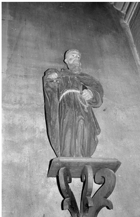
Vue d'ensemble en 1968.