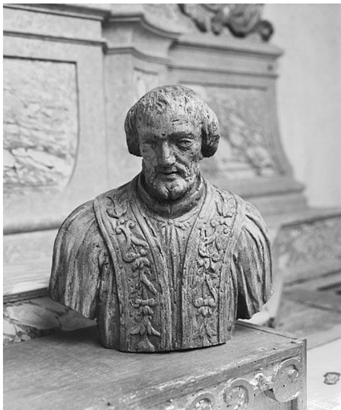
Saint Ferjeux. 25, Dommartin