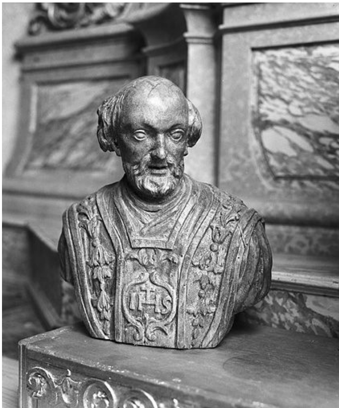
Saint Ferréol. 25, Dommartin