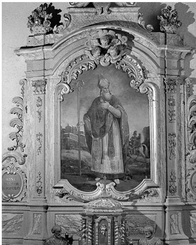
Vue générale. 25, Dommartin