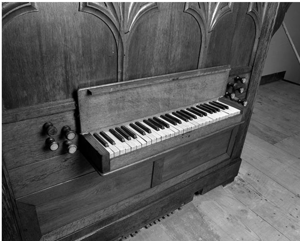
Détail de la console, clavier vu de trois quarts gauche. 25, Servin