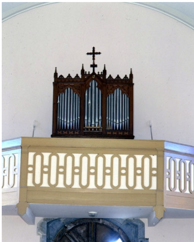
Vue générale de face en contre-plongée. 25, Servin