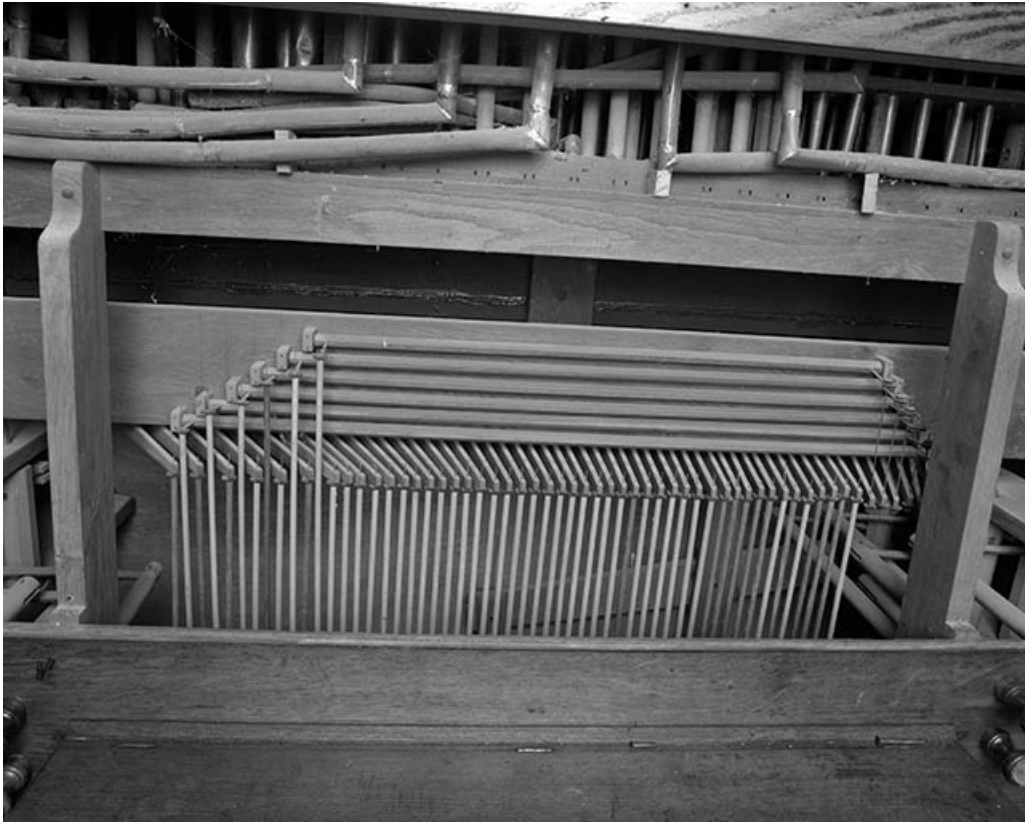
Mécanique vue de face.