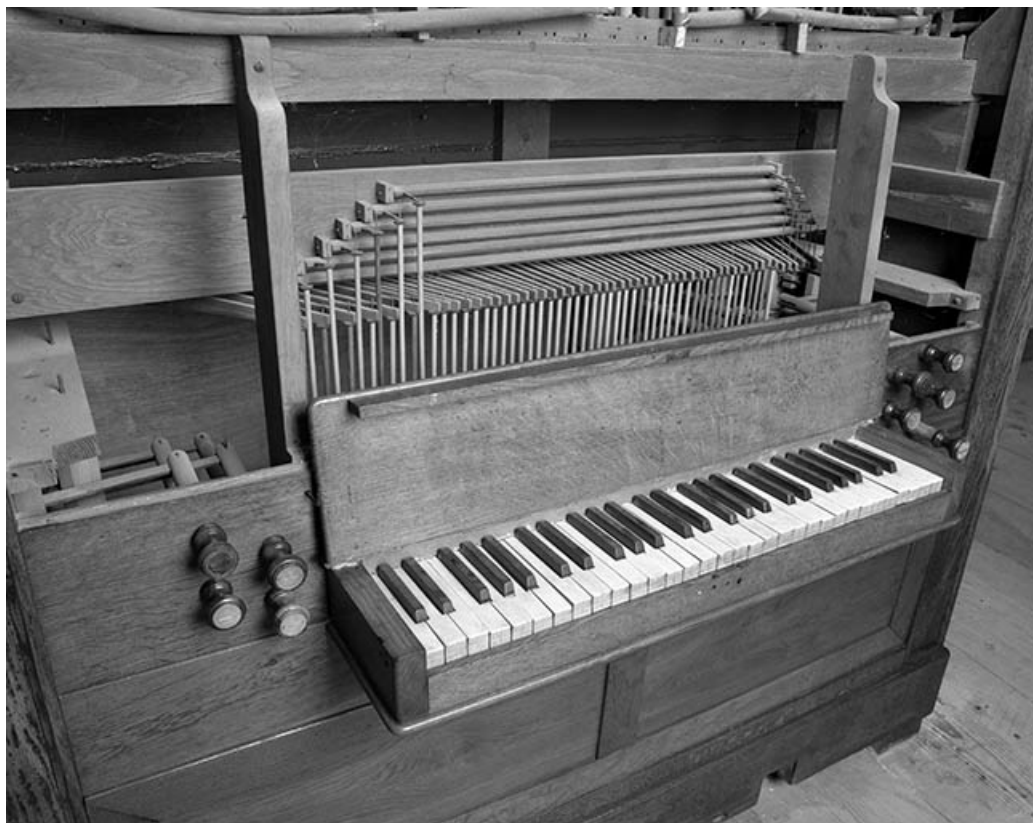
Console vue de trois quarts gauche. 25, Servin