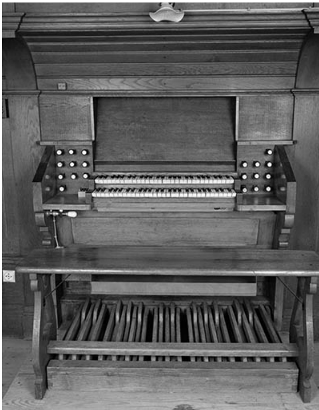
Console vue de face.