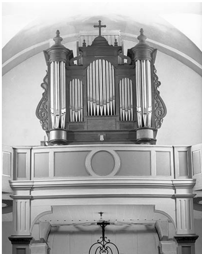
Vue générale de face en contre-plongée. 25, Saône