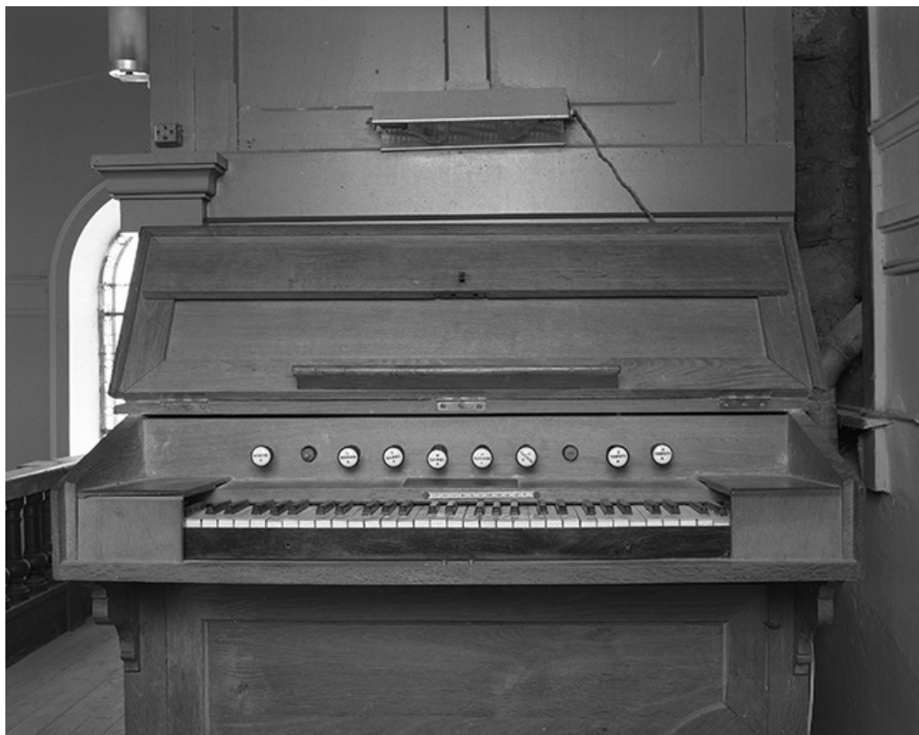
Console vue de face.