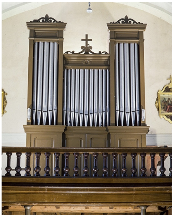
Vue générale de face.