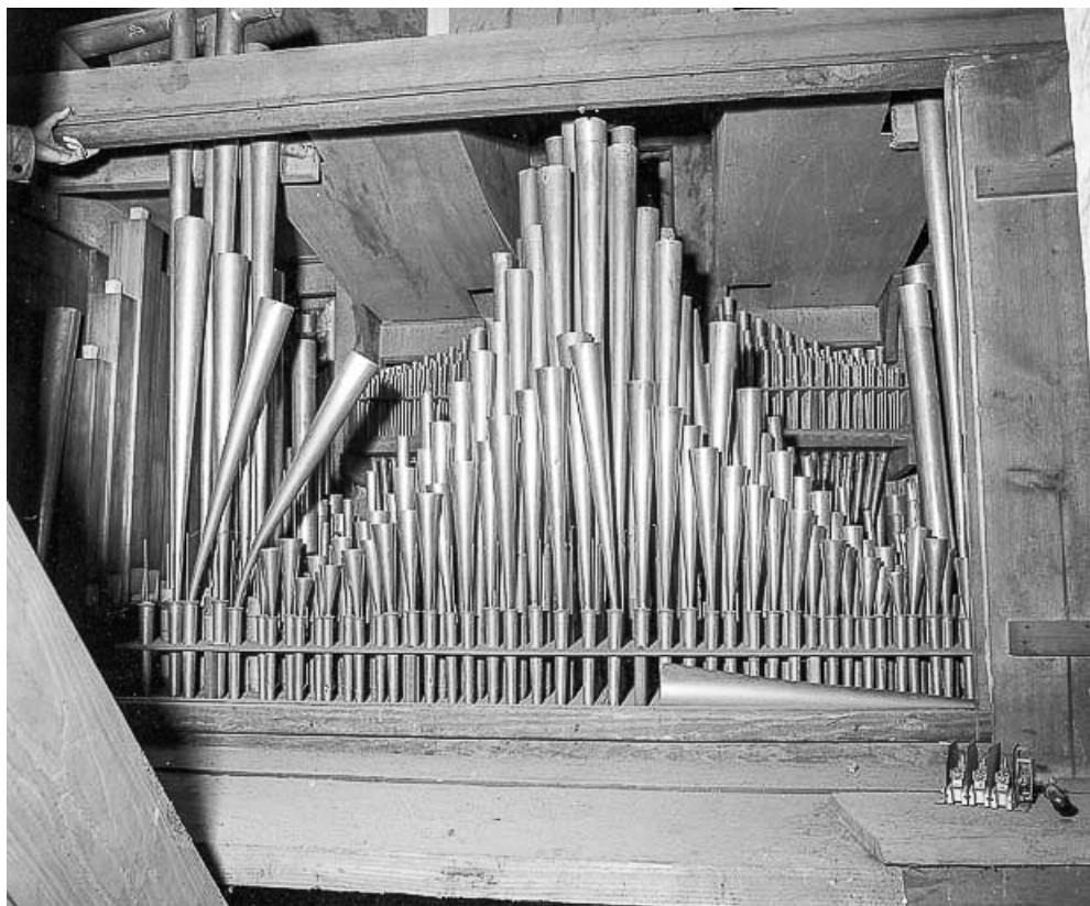
Tuyauterie vue de face.