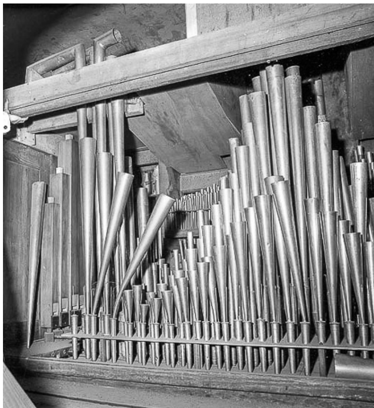
Tuyauterie vue de trois quarts droit.