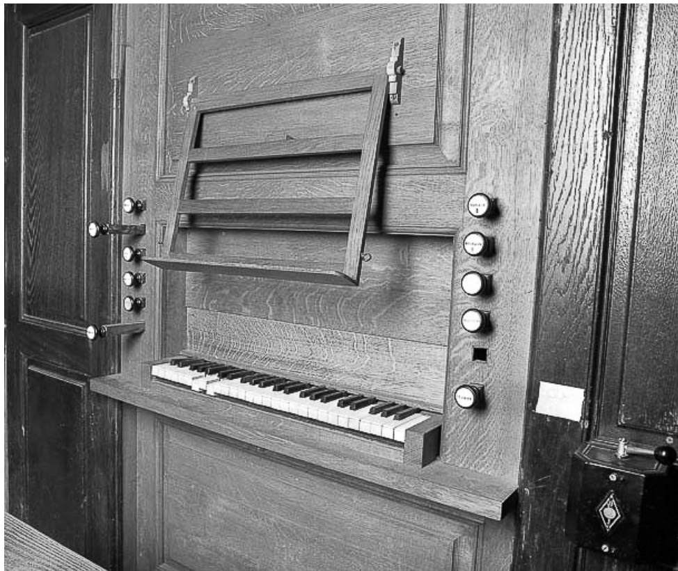
Console vue de trois quarts droit.