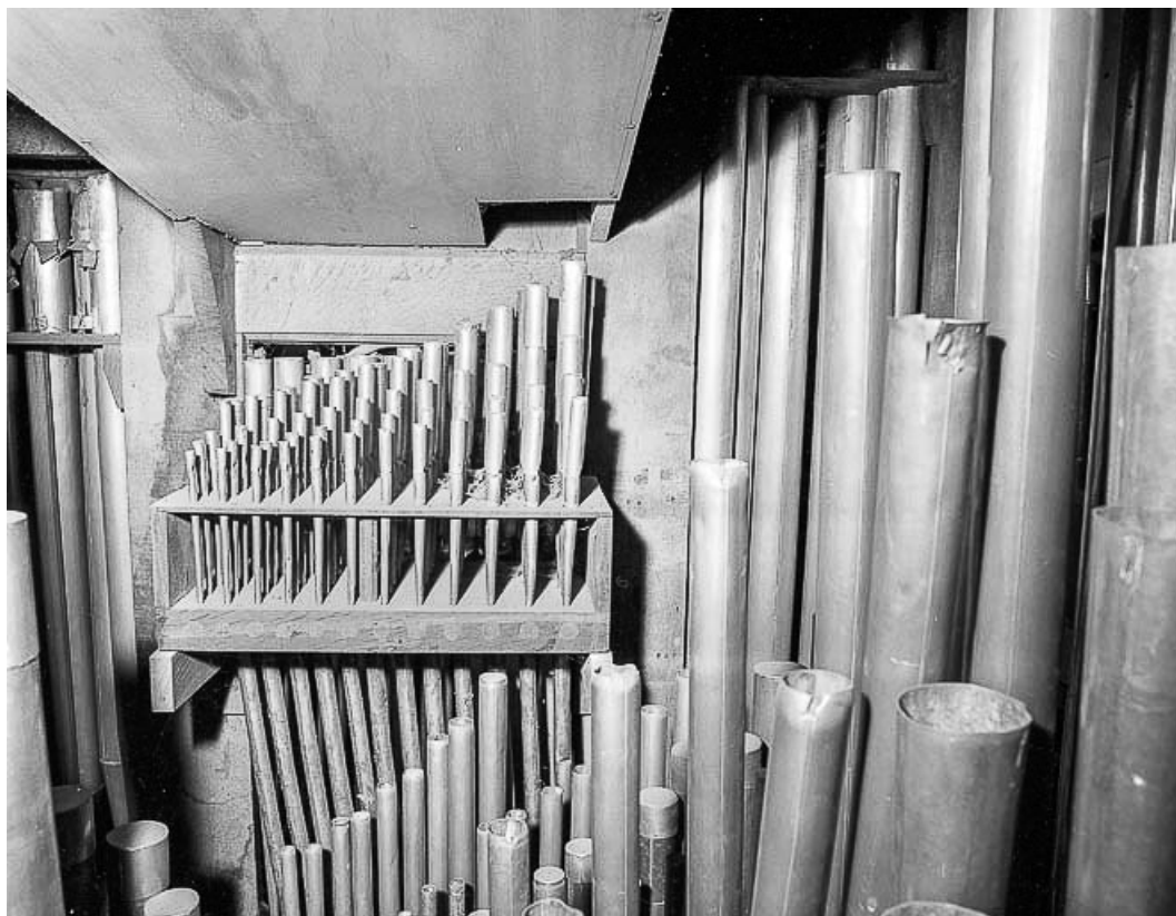
Tuyauterie, jeu de cornet.