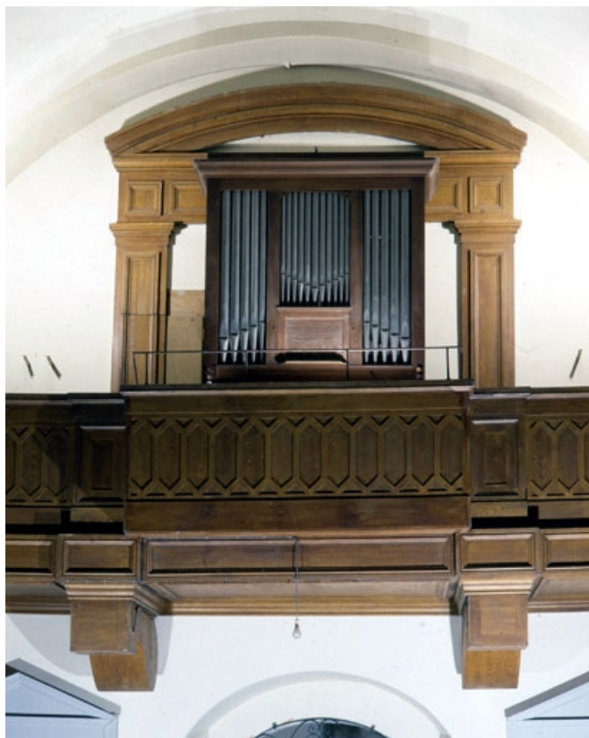
Vue générale de face en contre-plongée.