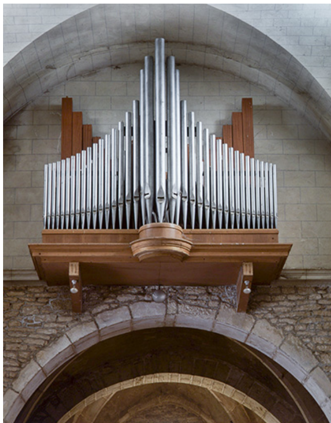
Buffet du grand orgue, vue générale de face. 25, Rougemont quartier de la Citadelle