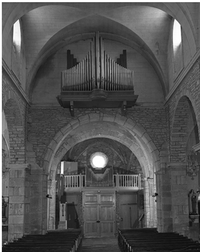
Ensemble des buffets, vue générale de face.