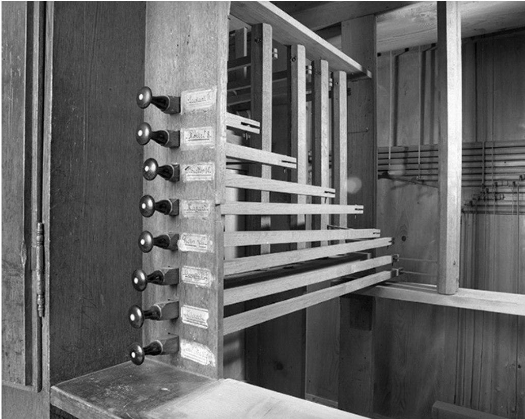
Mécanique, tirage des jeux vu de trois quarts droit. 25, Quingey