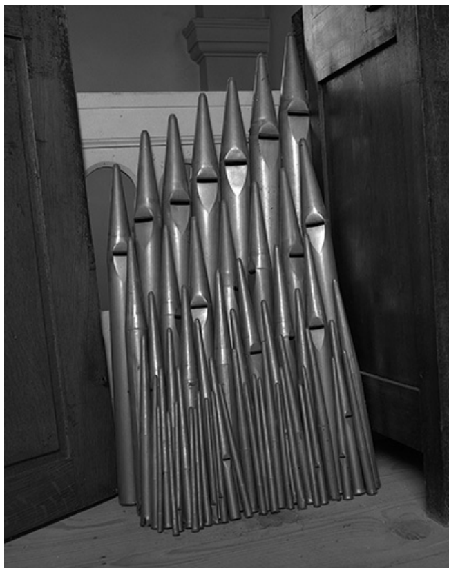
Tuyauterie déposée, vue de face.