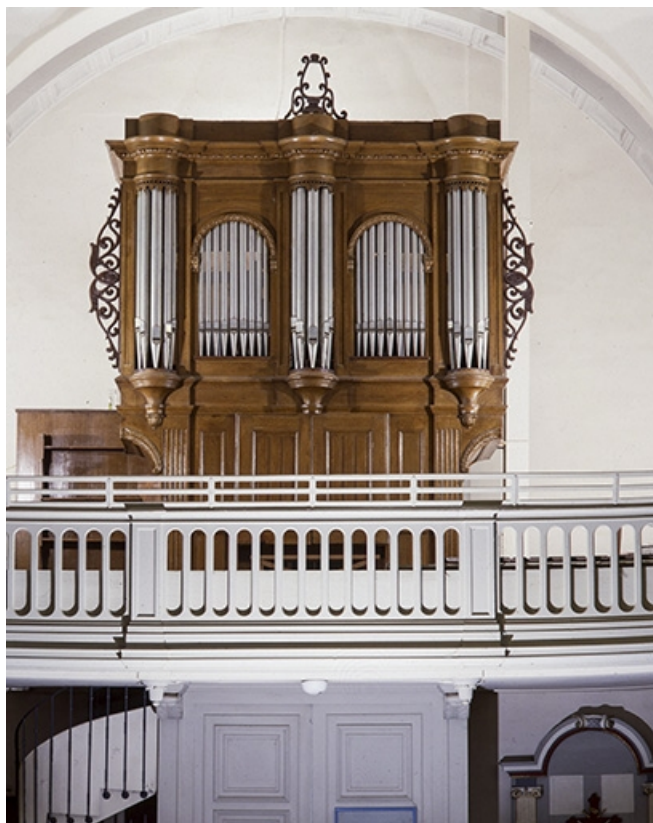
Vue générale de face. 25, Quingey