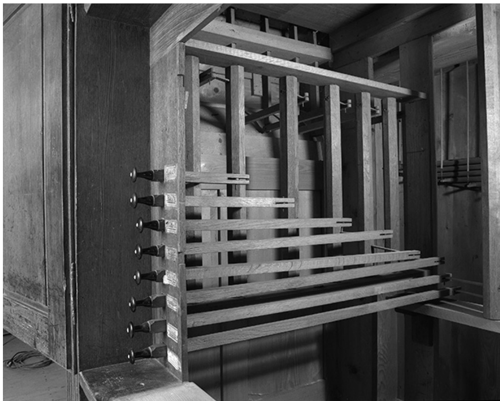
Mécanique, tirage des jeux vu de trois quarts droit. 25, Quingey