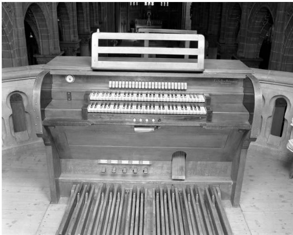
Console vue de face.