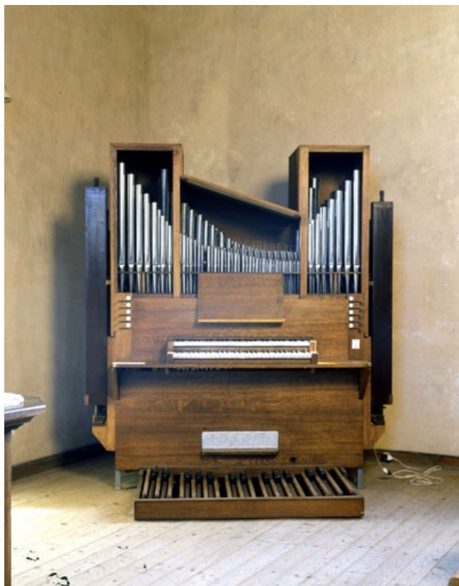
Vue générale de face.