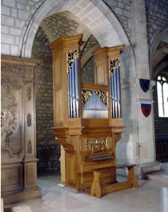
Vue générale de trois quarts gauche.