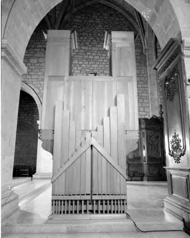
Revers de l'instrument, vue générale de face.