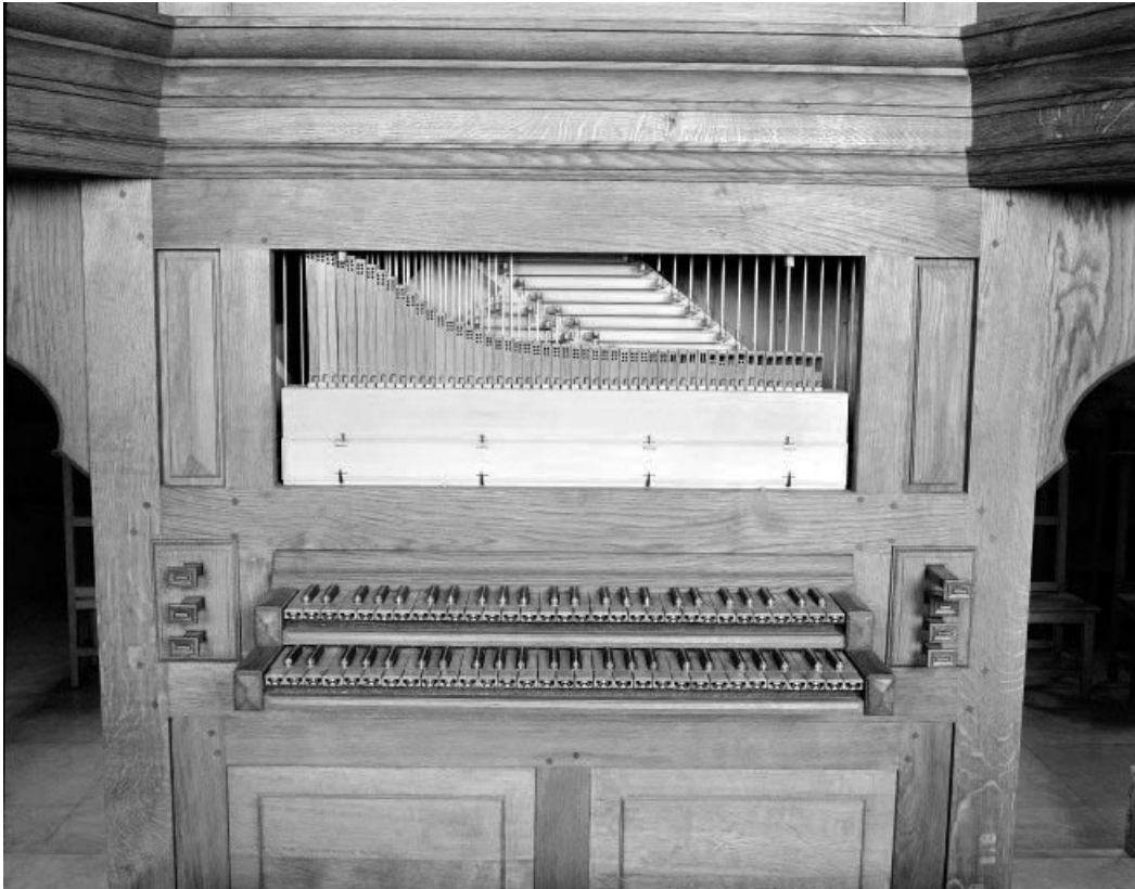
Console vue de face.