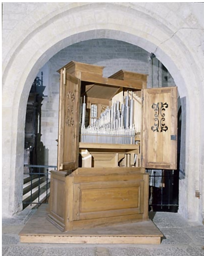
Vue du revers de l'instrument, vue générale de trois quarts gauche. 25, Montbenoît