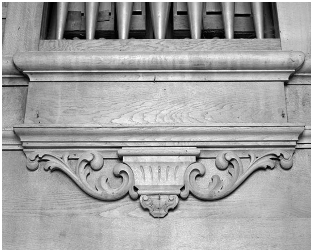
Cul-de-lampe sous la tourelle centrale. 25, Landresse