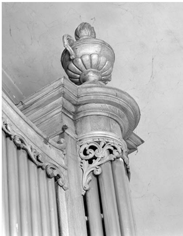
Couronnement d'une tourelle.