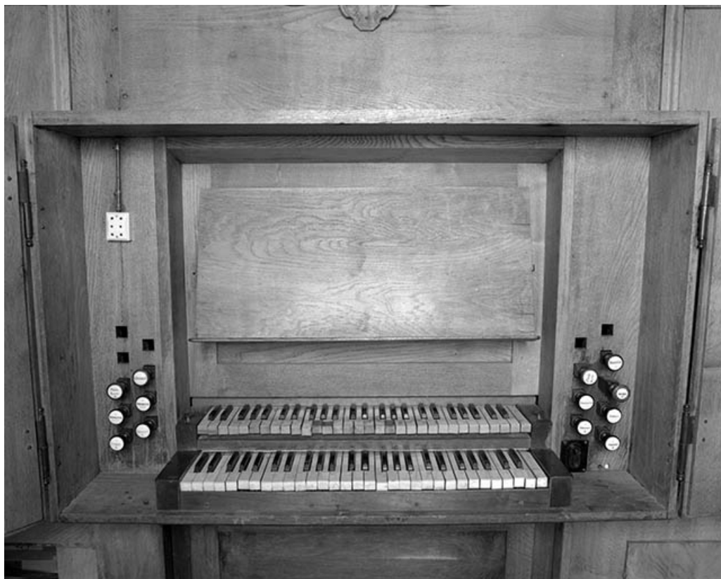
Console vue de face.