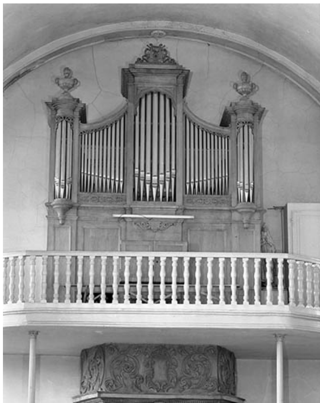
Vue générale de face en contre-plongée. 25, Landresse