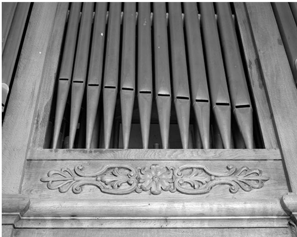
Panneau sculpté sous une plate-face.