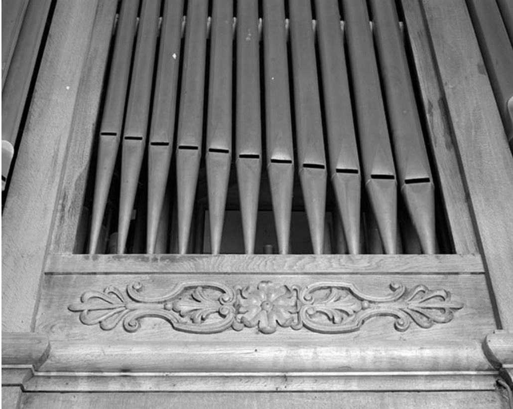
Panneau sculpté sous une plate-face. 25, Landresse