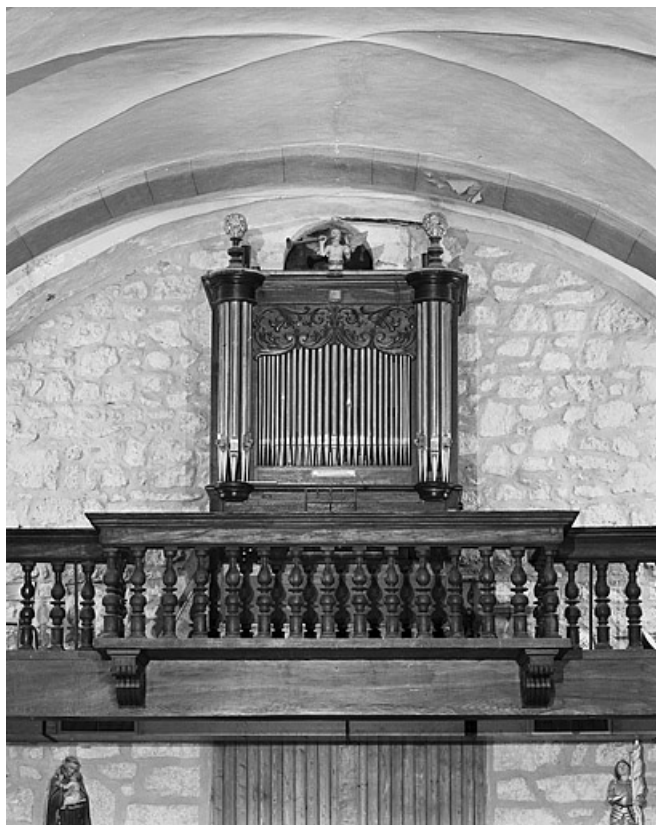
Vue générale de face. 25, Les Hôpitaux-Neufs