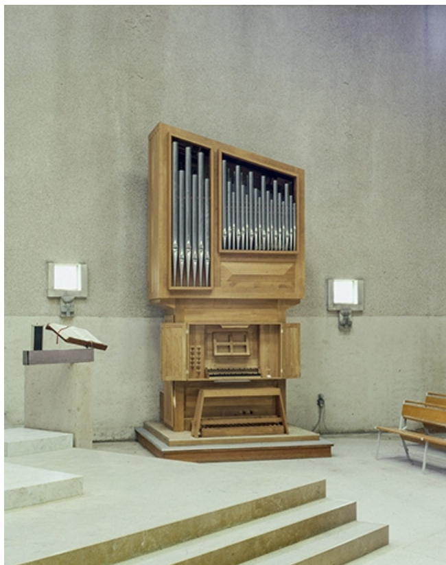
Vue générale de face.