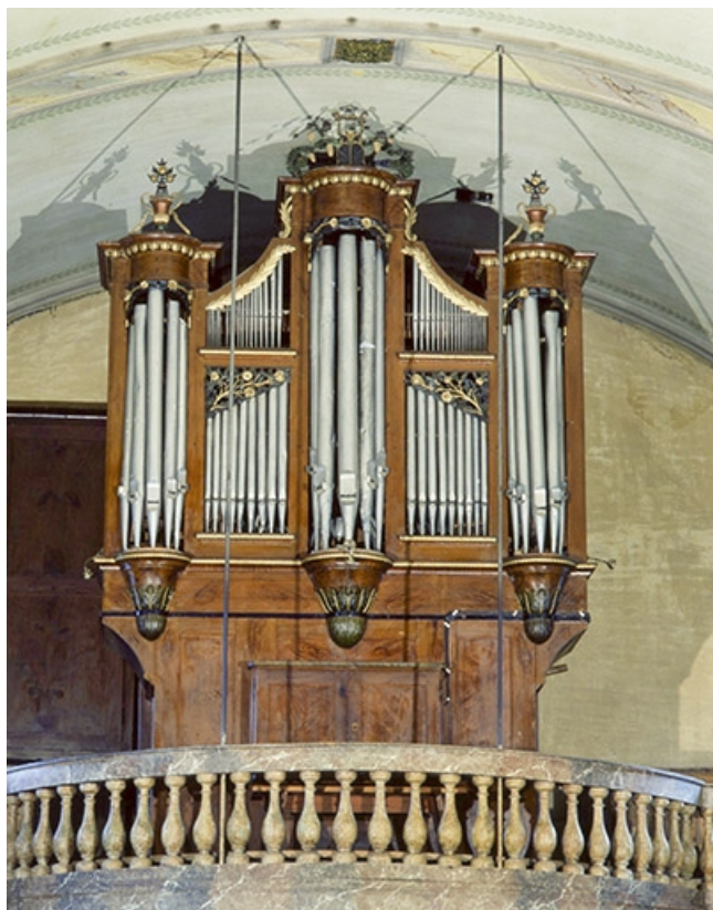
Vue générale de face.