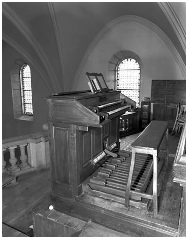
Console vue de trois quarts gauche. 25, Gilley