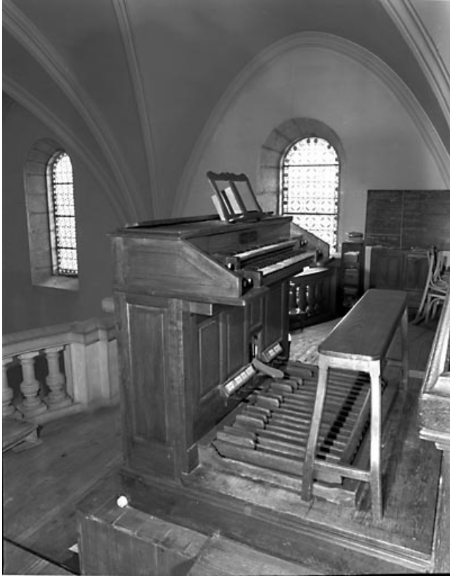
Console vue de trois quarts gauche. 25, Gilley