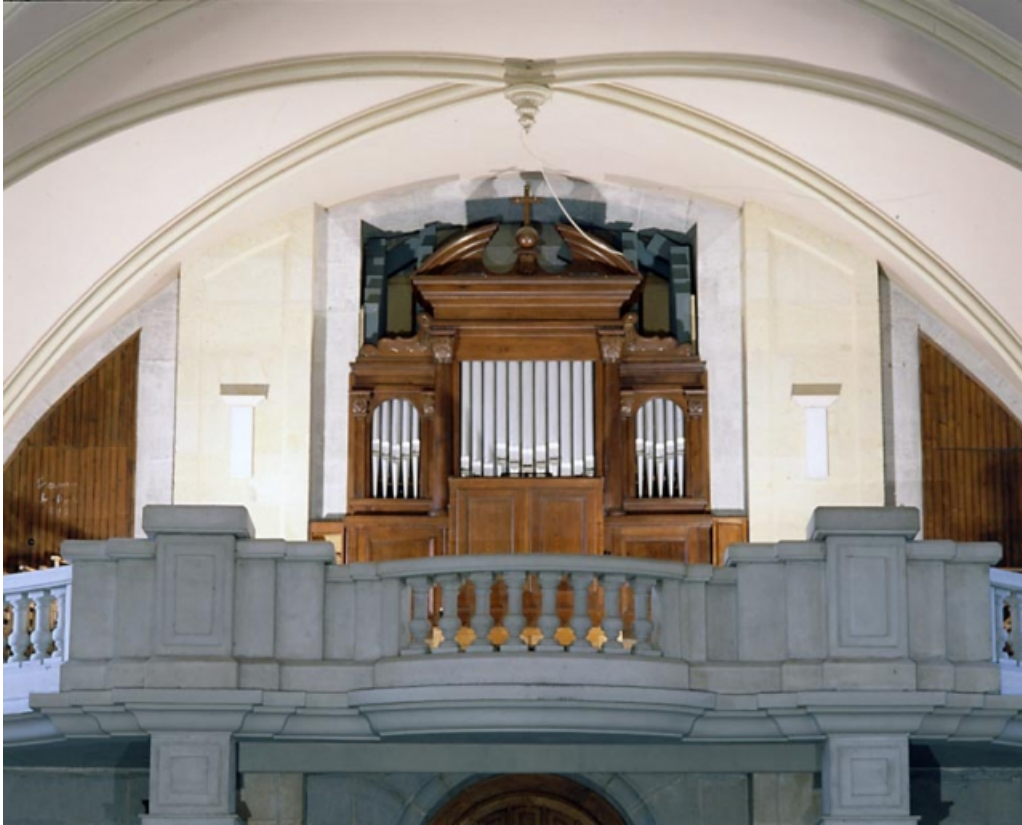
Vue générale de face.