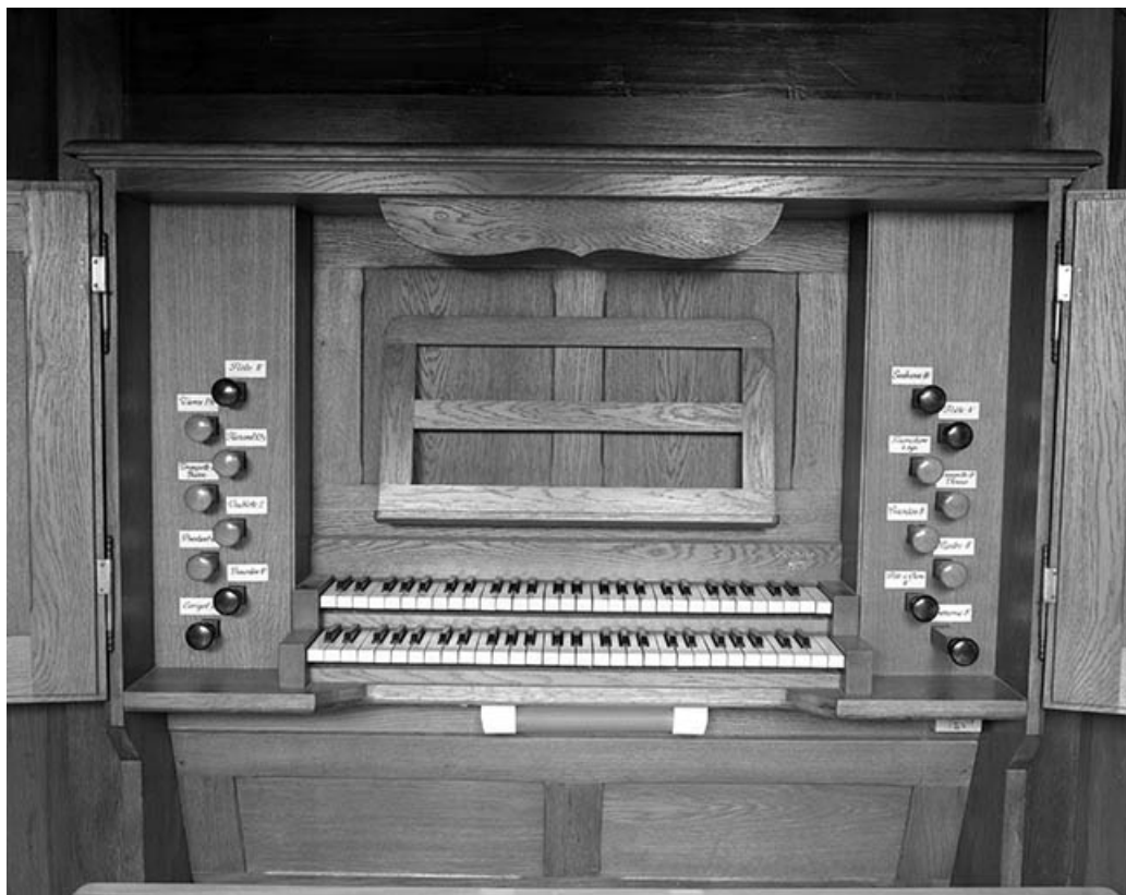
Console vue de face. 25, Franois