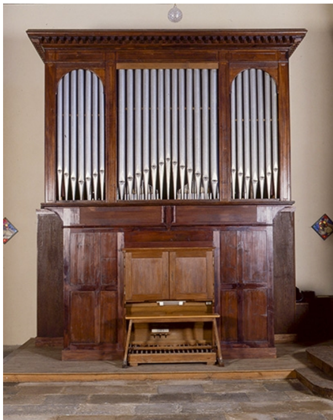
Vue générale de face.