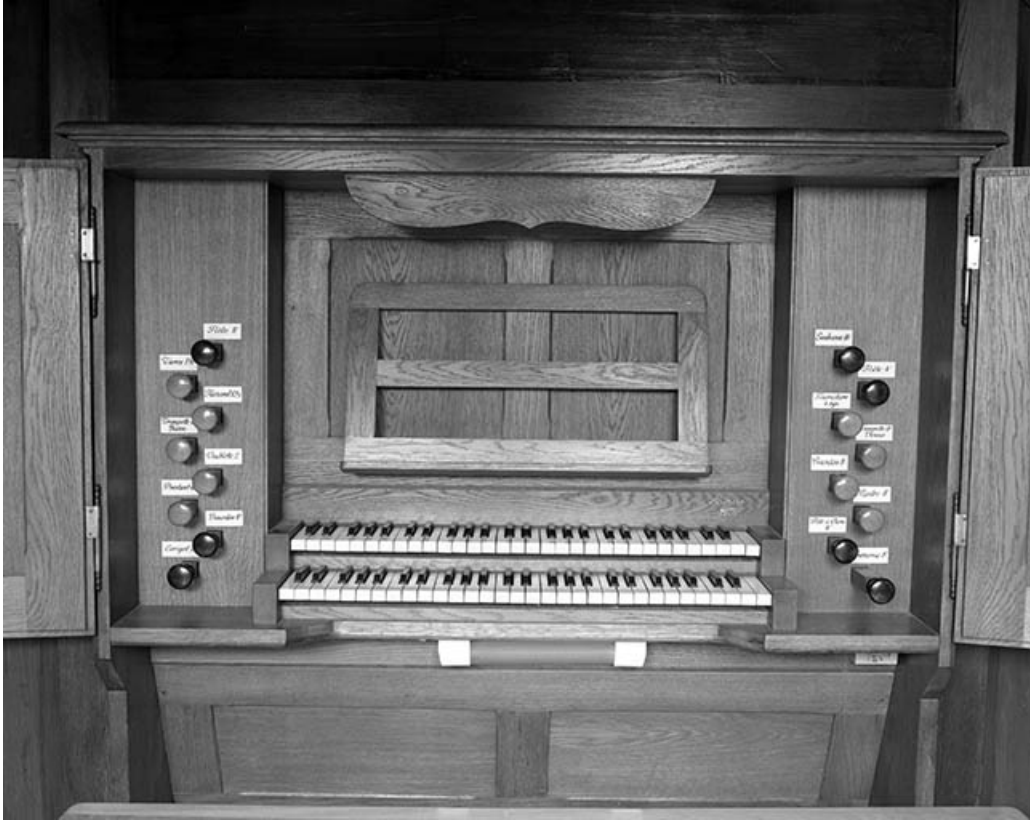
Console vue de face.