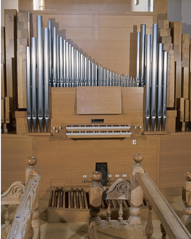
Vue générale de face.