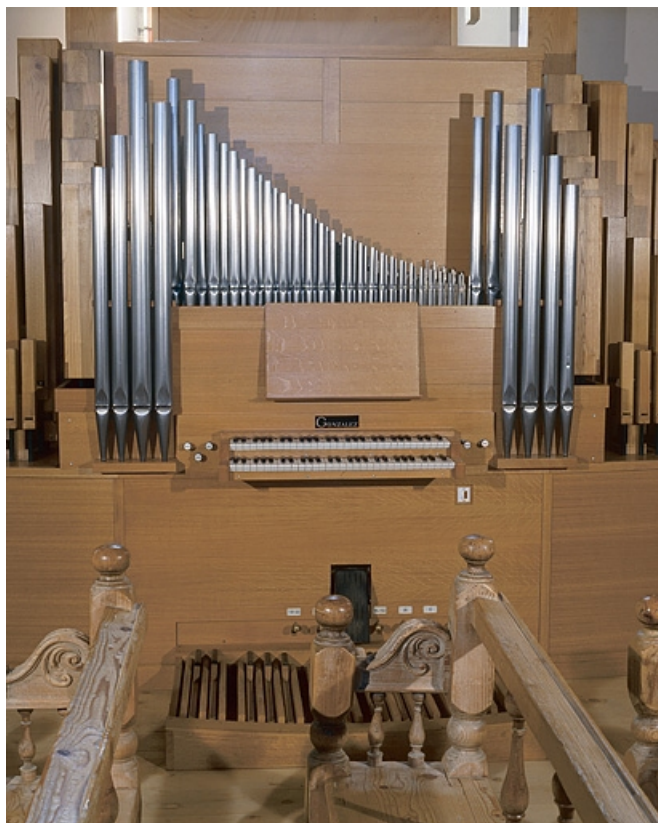
Vue générale de face.