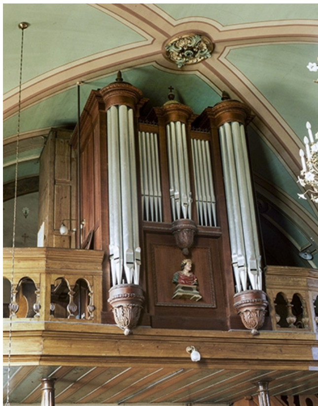
Vue générale de trois quarts gauche. 25, Les Fontenelles