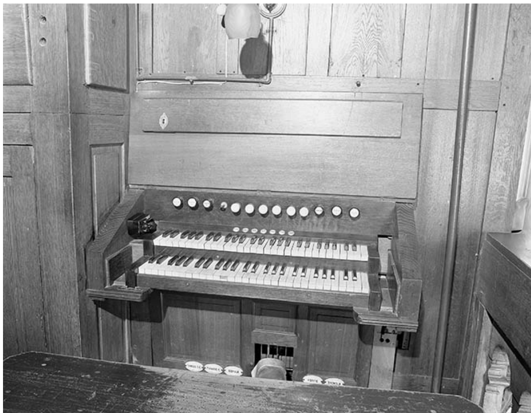
Console vue de face.