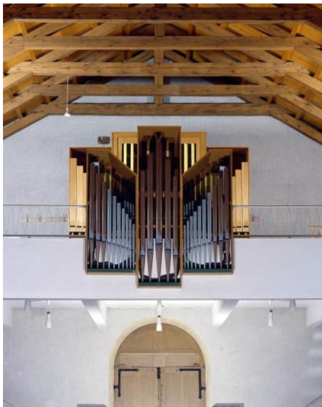
Vue générale de face en contre-plongée. 25, Les Fins