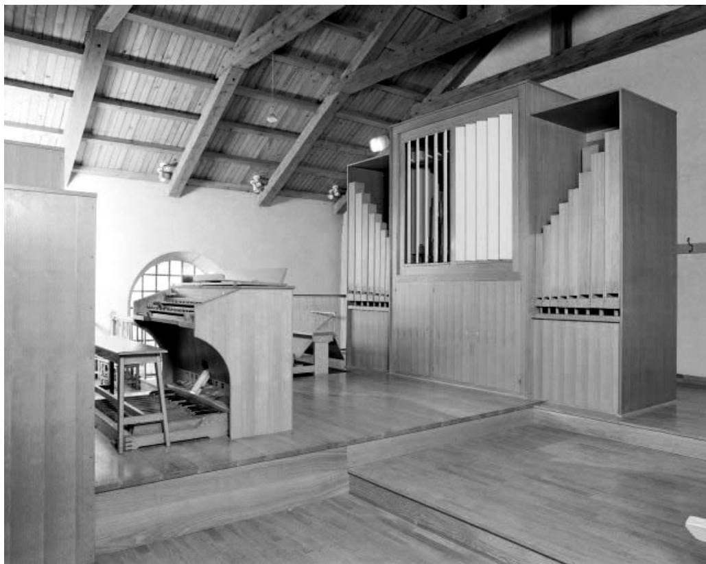
Console et revers du buffet.