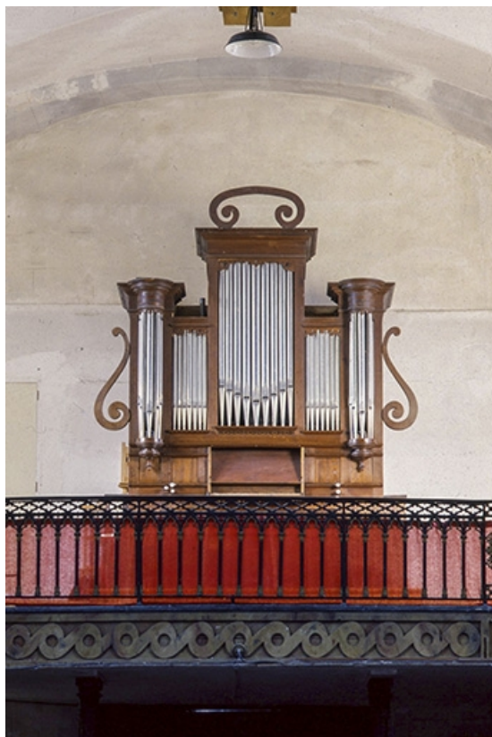
Vue générale de trois quarts droit. 25, Déservillers