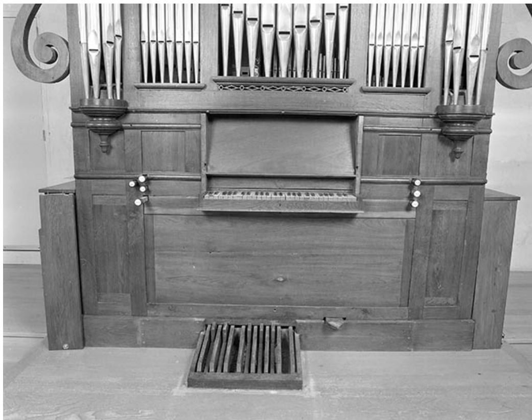
Console vue de face.