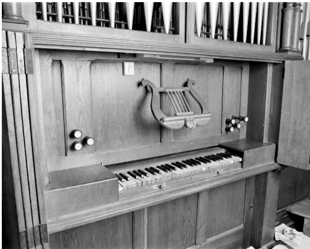
Console vue de trois quarts gauche. 25, Montlebon, lieudit : Derrière le Mont