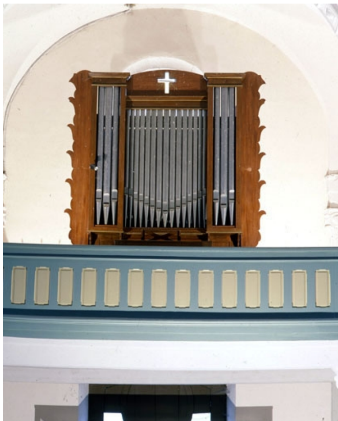
Vue générale de face.