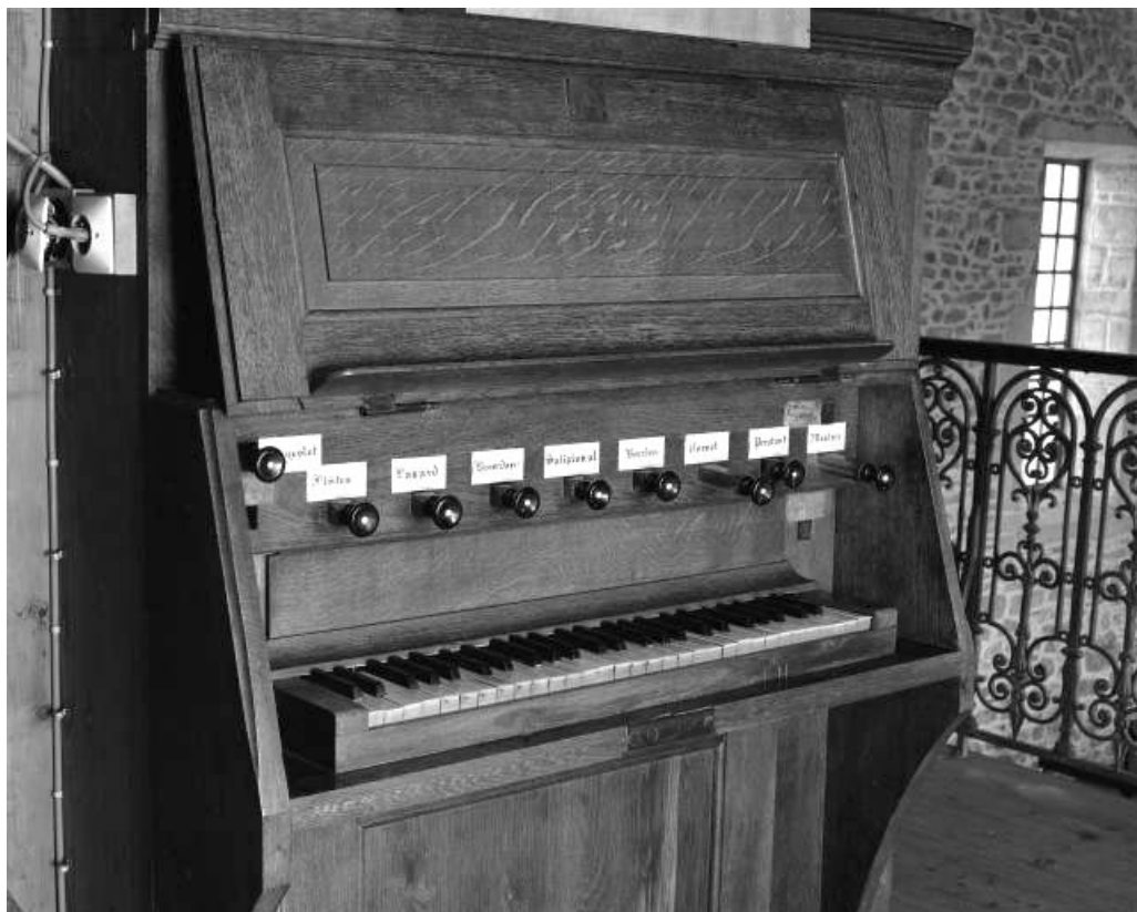
Détail de la console vue de trois quarts gauche. 25, Dampierre-les-Bois