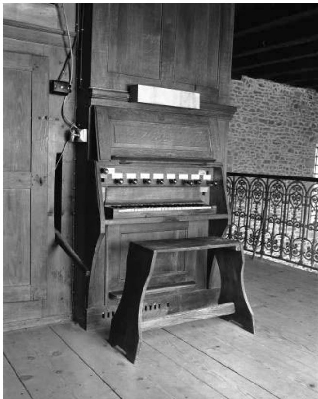
Console vue de trois quarts gauche. 25, Dampierre-les-Bois