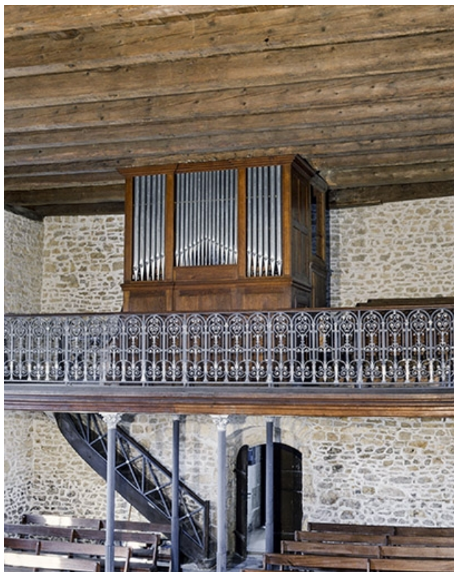
Vue générale de trois quarts droit. 25, Dampierre-les-Bois