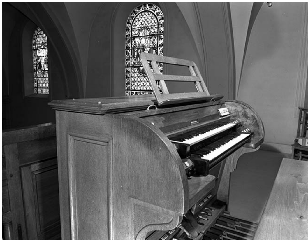
Console vue de trois quarts gauche. 25, Charmauvillers