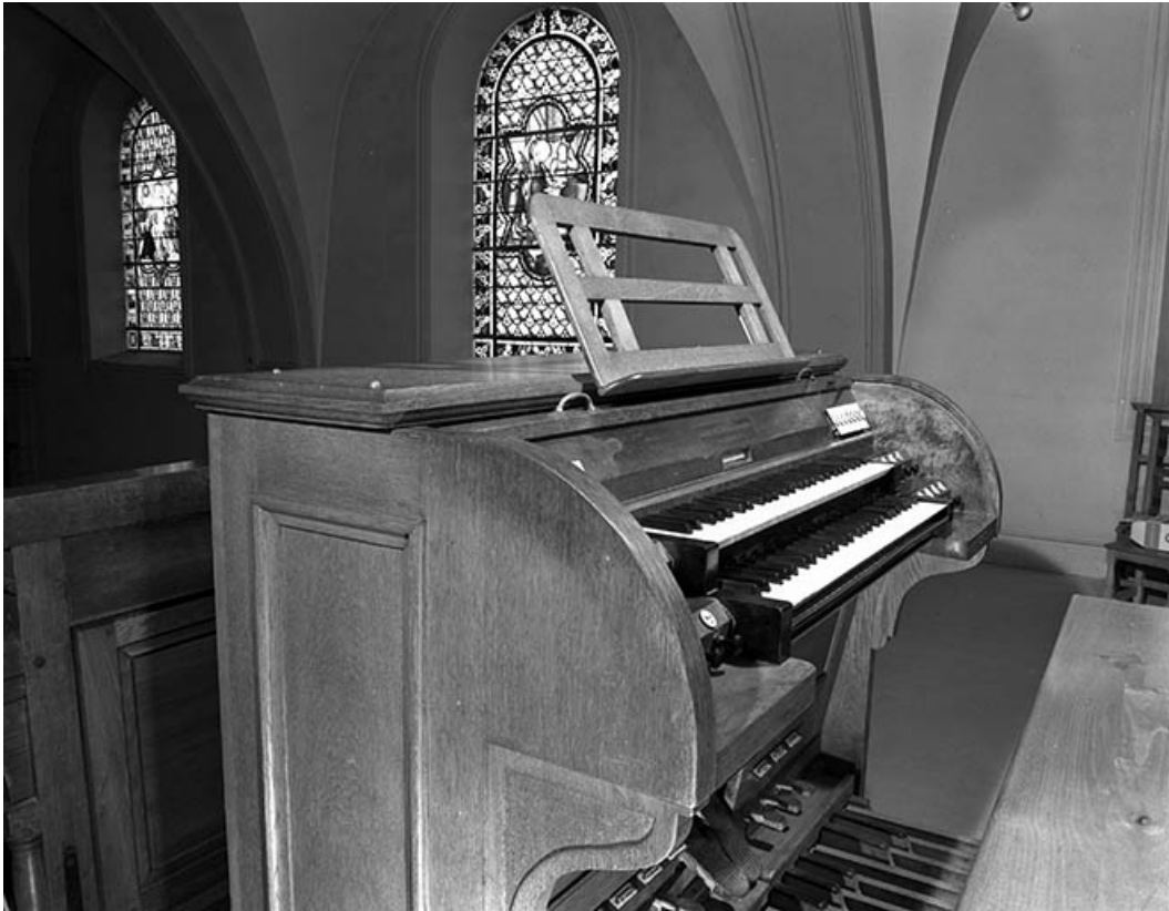
Console vue de trois quarts gauche. 25, Charmauvillers