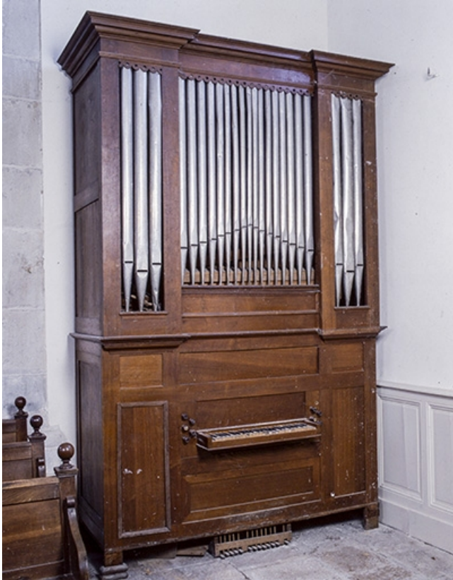
Vue générale de trois quarts gauche.