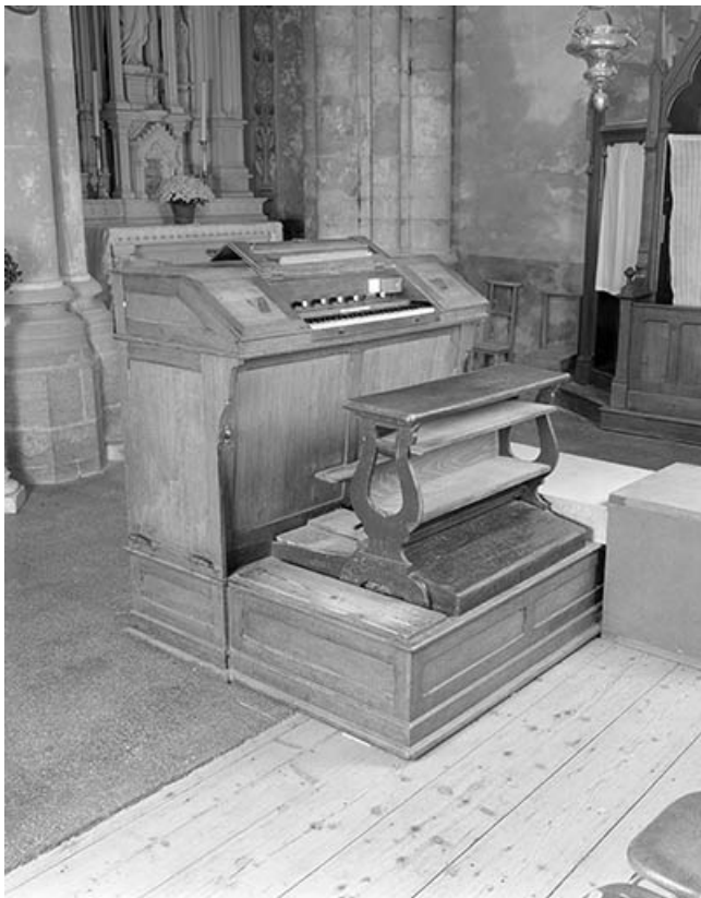
Vue générale de trois quarts gauche. 25, Bolandoz