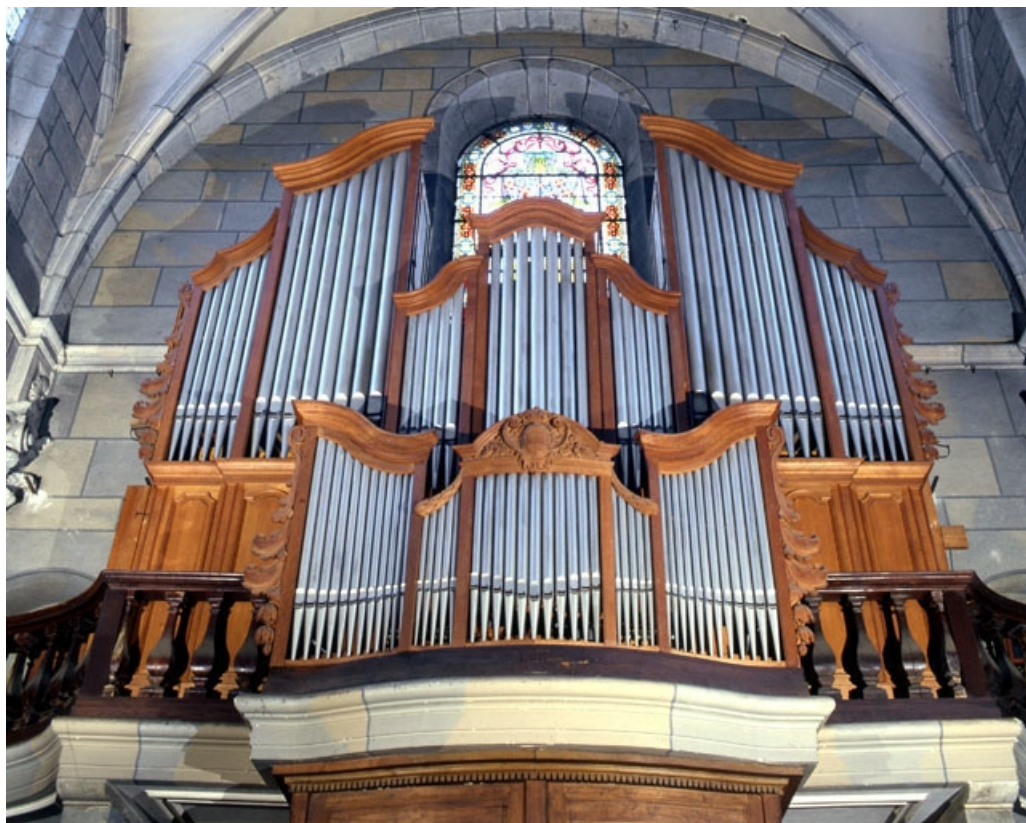
Vue générale de face en contre-plongée.