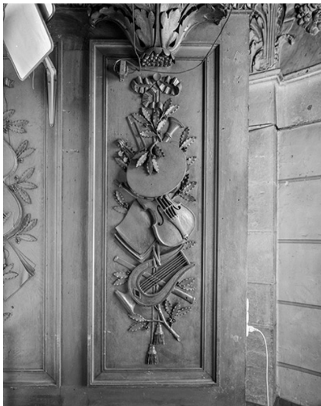
Détail du soubassement du buffet, panneau sculpté de droite vu de face.