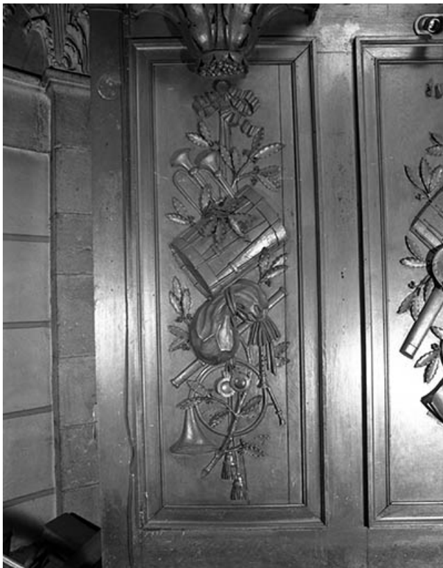
Détail du soubassement du buffet, panneau sculpté de droite vu de face.