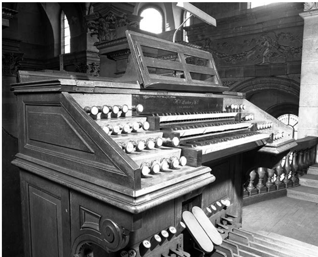
Console vue de trois quarts gauche.