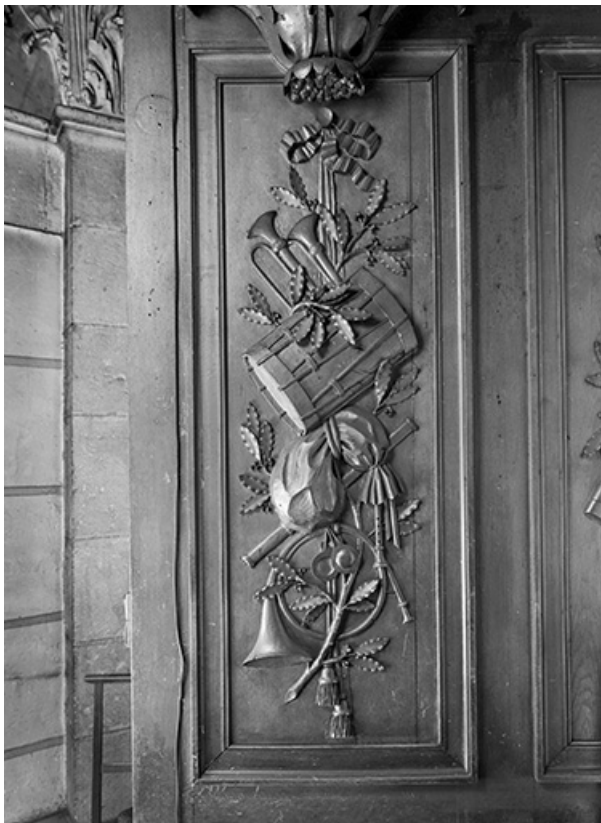
Détail du soubassement du buffet, panneau sculpté de gauche vu de face. 25, Besançon place du 8 Septembre