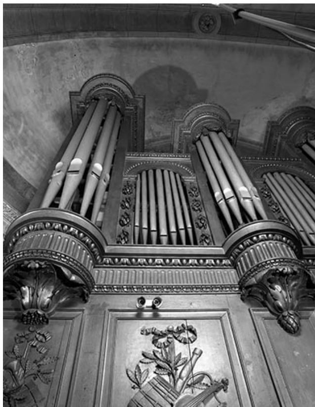
Tourelles gauches du grand orgue vues en contre-plongée.