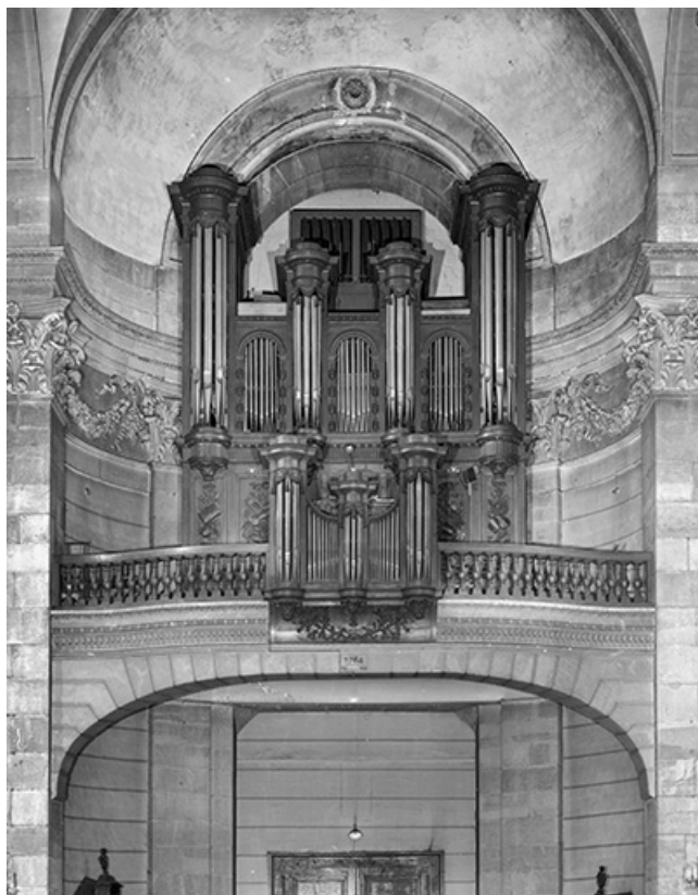
Vue générale de face.