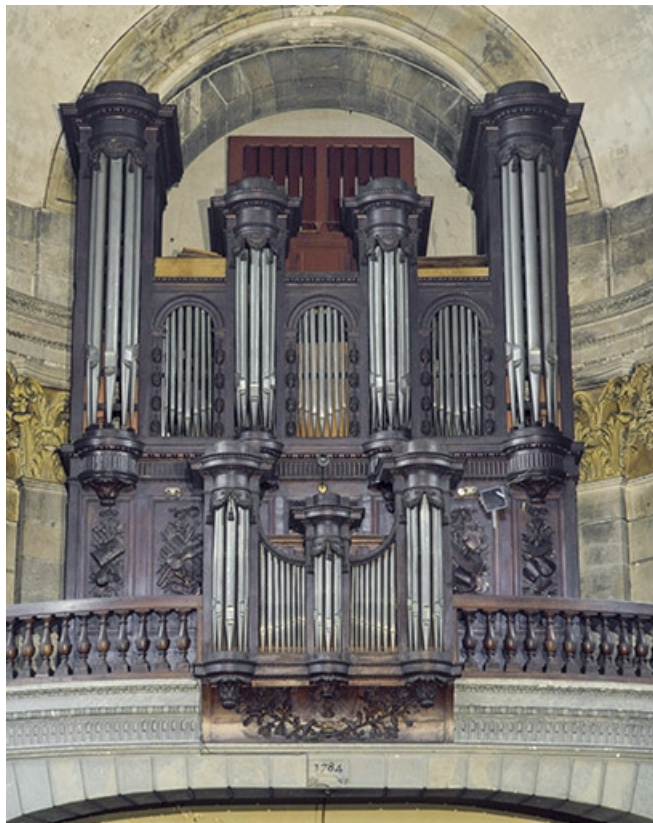
Vue générale de face.