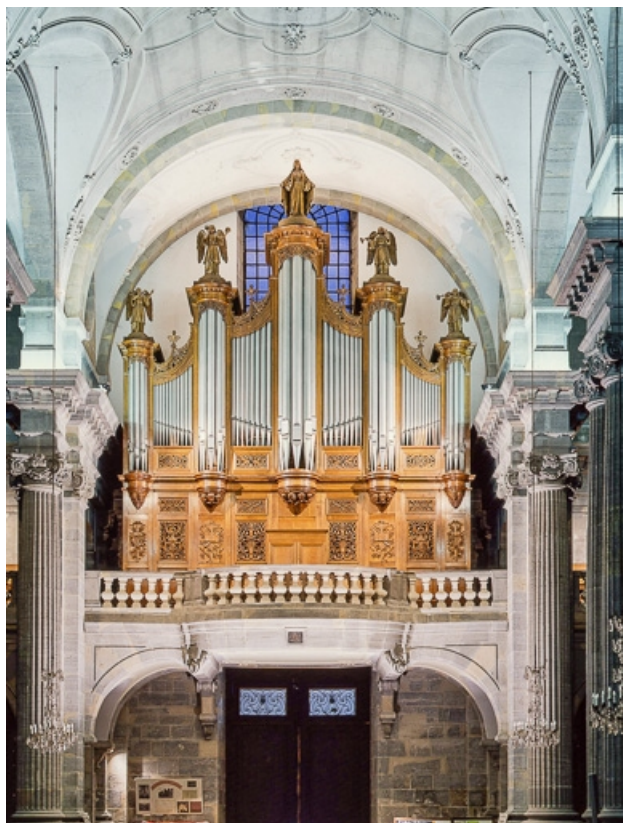
Vue générale de face après restauration.