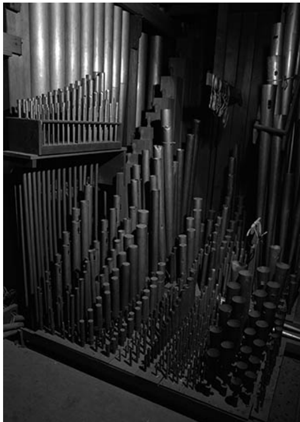
Tuyauterie vue de trois quarts gauche.