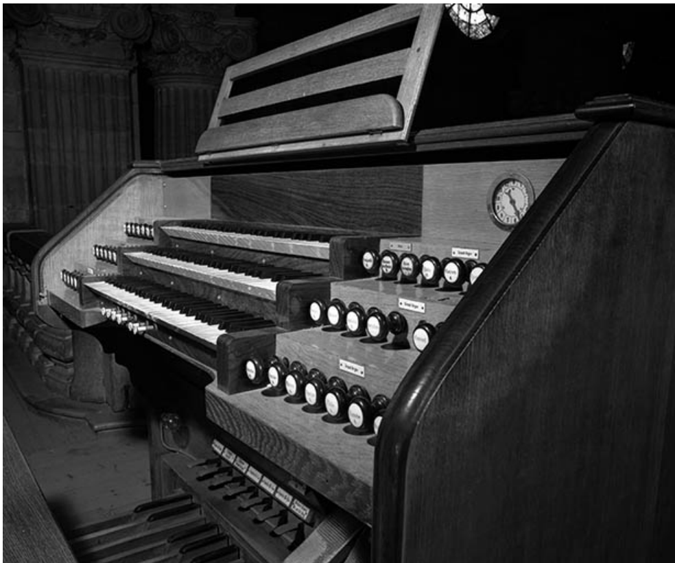
Console vue de trois quarts droit.