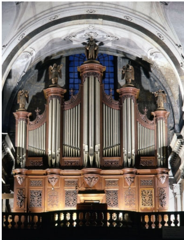
Vue générale de face avant restauration.