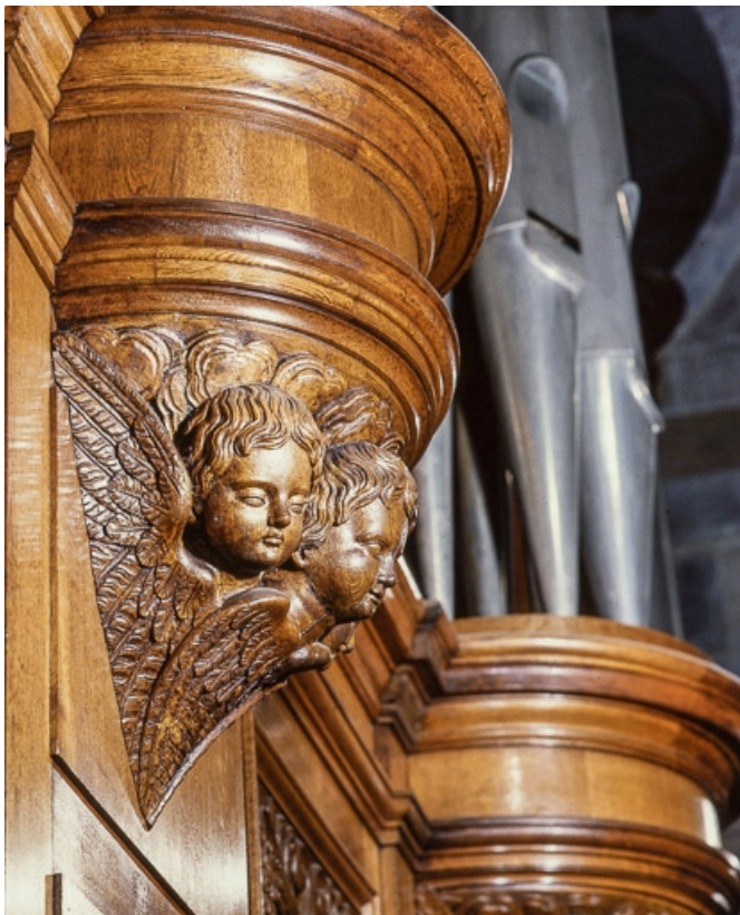
Culot d'une tourelle latérale vu de trois quarts après restauration. 25, Besançon rue de la Madeleine