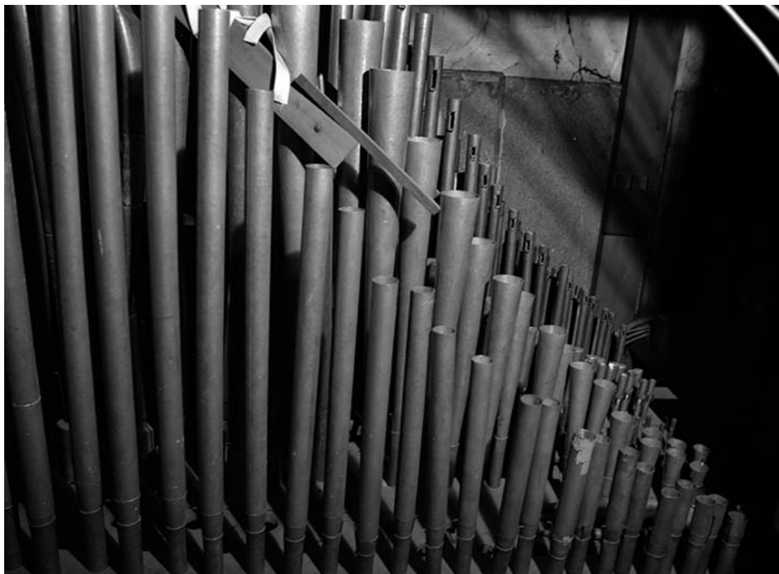
Tuyauterie vue de face.