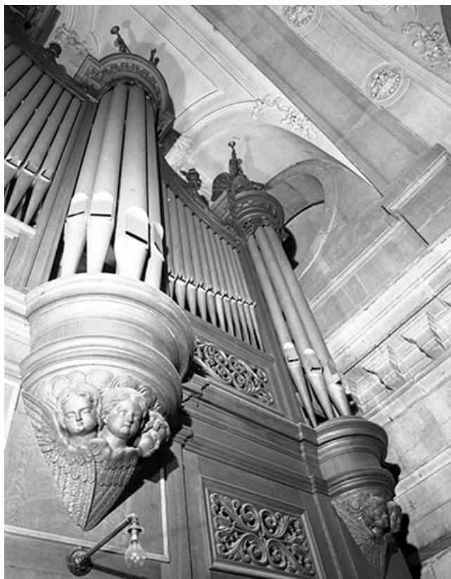
Tourelles droites vues de trois quarts gauche en contre-plongée. 25, Besançon rue de la Madeleine