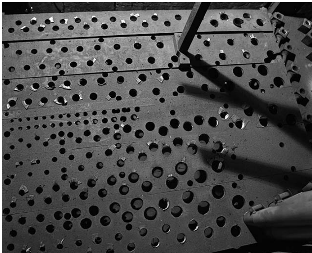
Sommier de récit vu en plongée.