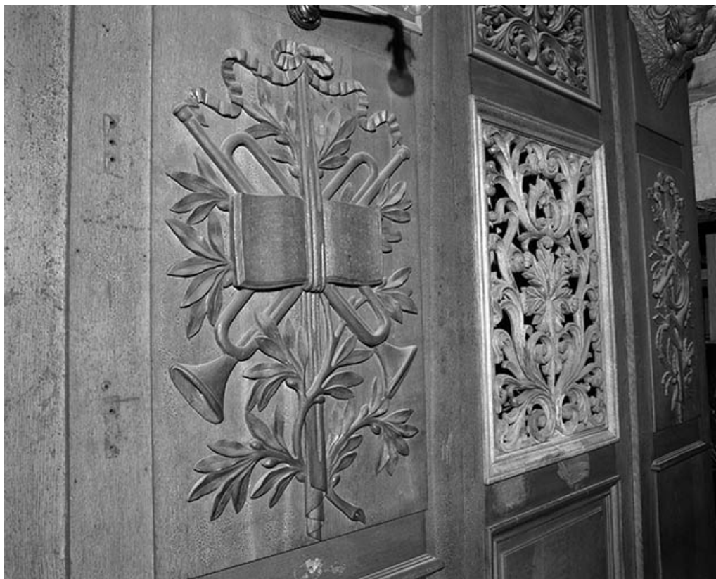
Partie basse du buffet, panneaux sculptés vus de trois quarts gauche. 25, Besançon rue de la Madeleine