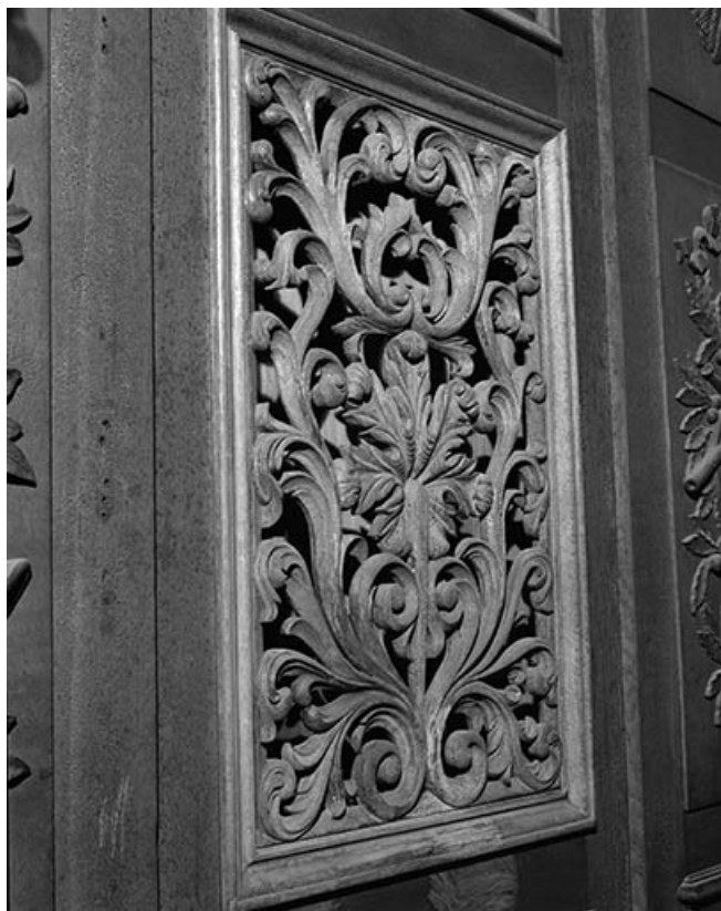
Partie basse du buffet, panneau sculpté vu de trois quarts gauche. 25, Besançon rue de la Madeleine