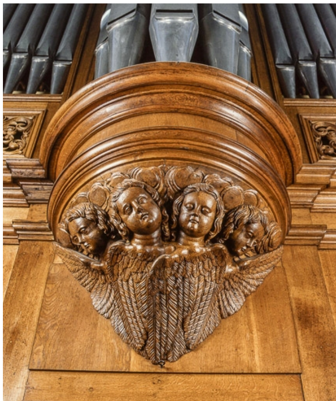
Culot de la tourelle centrale vu de face après restauration.