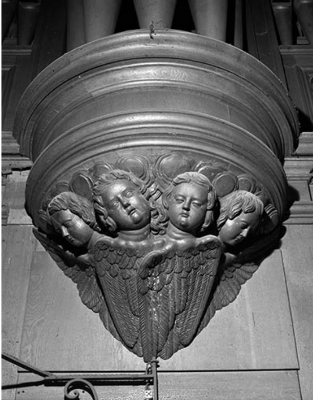
Culot de la tourelle centrale vu de face avant restauration. 25, Besançon rue de la Madeleine