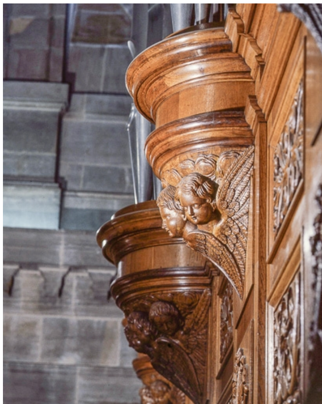
Culot d'une tourelle latérale vu de trois quarts après restauration. 25, Besançon rue de la Madeleine