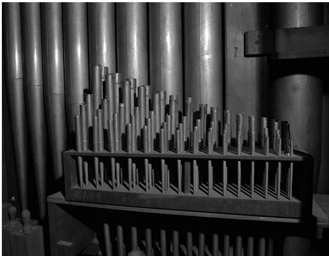
Tuyauteerie vue de trois quarts droit.