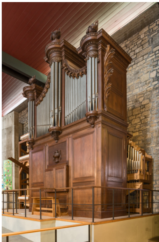
Vue de l'orgue (de trois quarts).