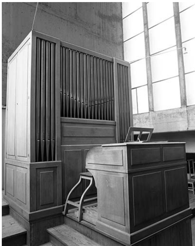
Vue générale de trois quarts gauche.