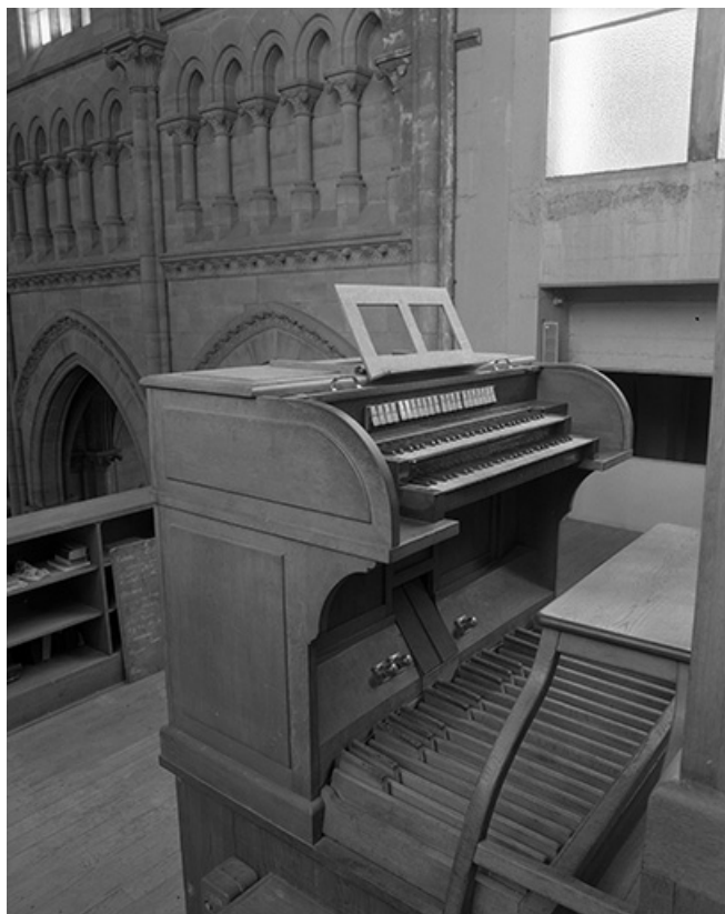
Console vue de trois quarts gauche.