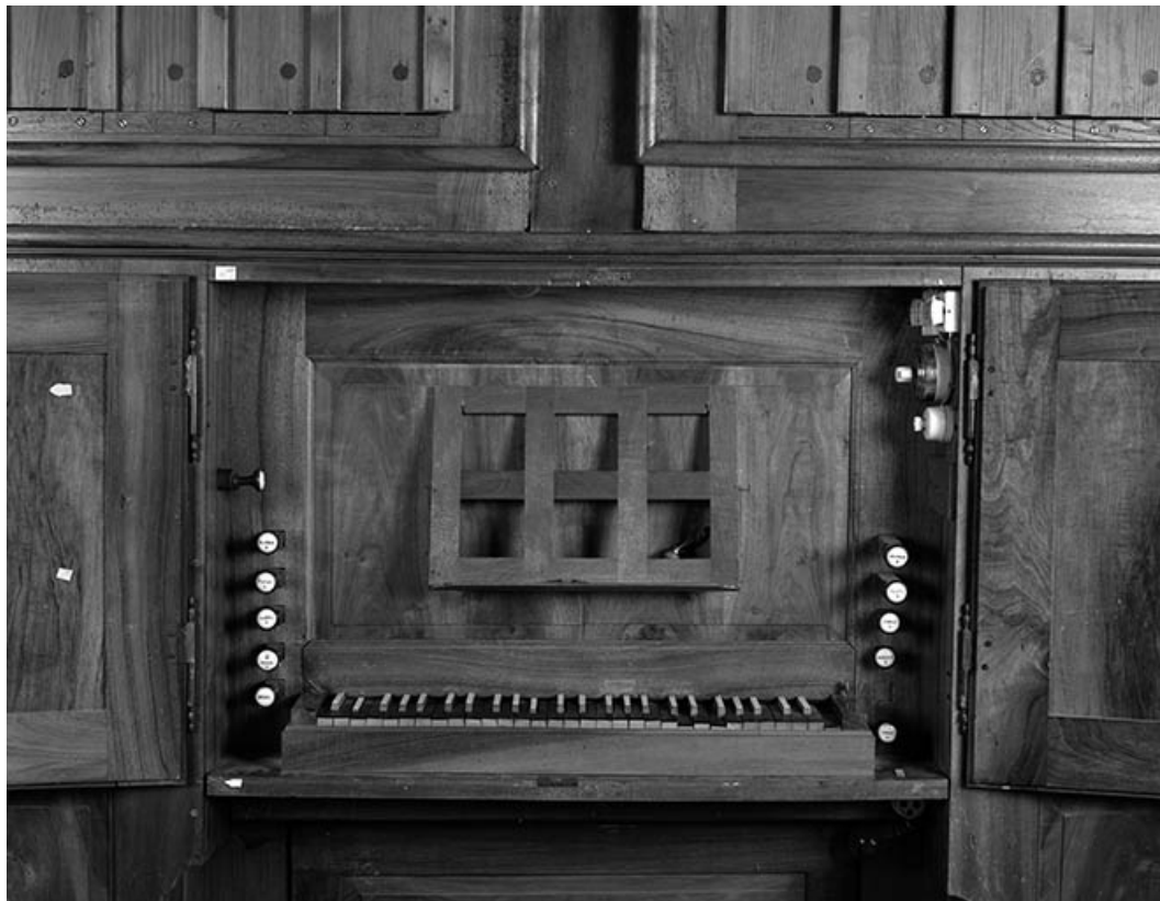
Console vue de face.