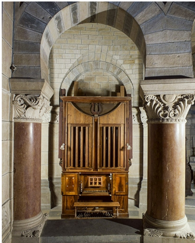
Vue générale de face, volets fermés.