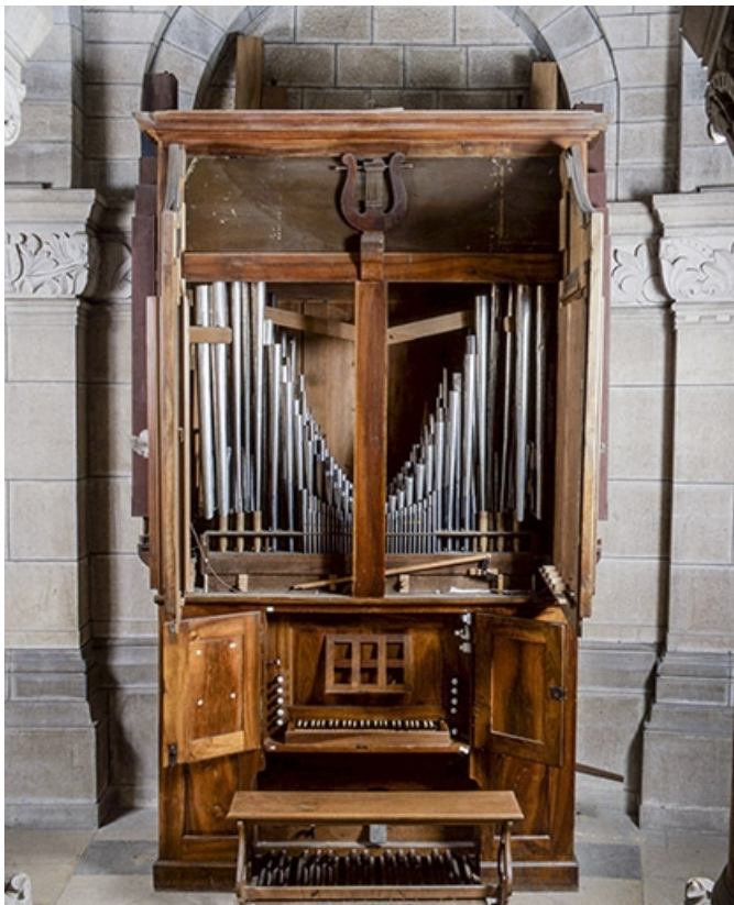
Vue générale de face, volets ouverts.