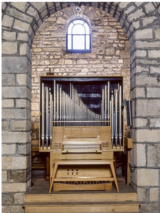
Vue générale de face.