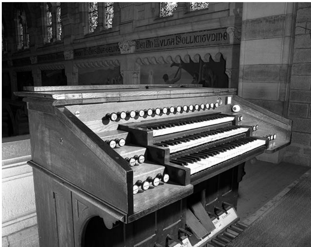
Console vue de face.