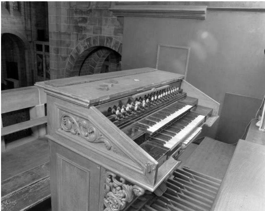
Console vue de trois quarts gauche.