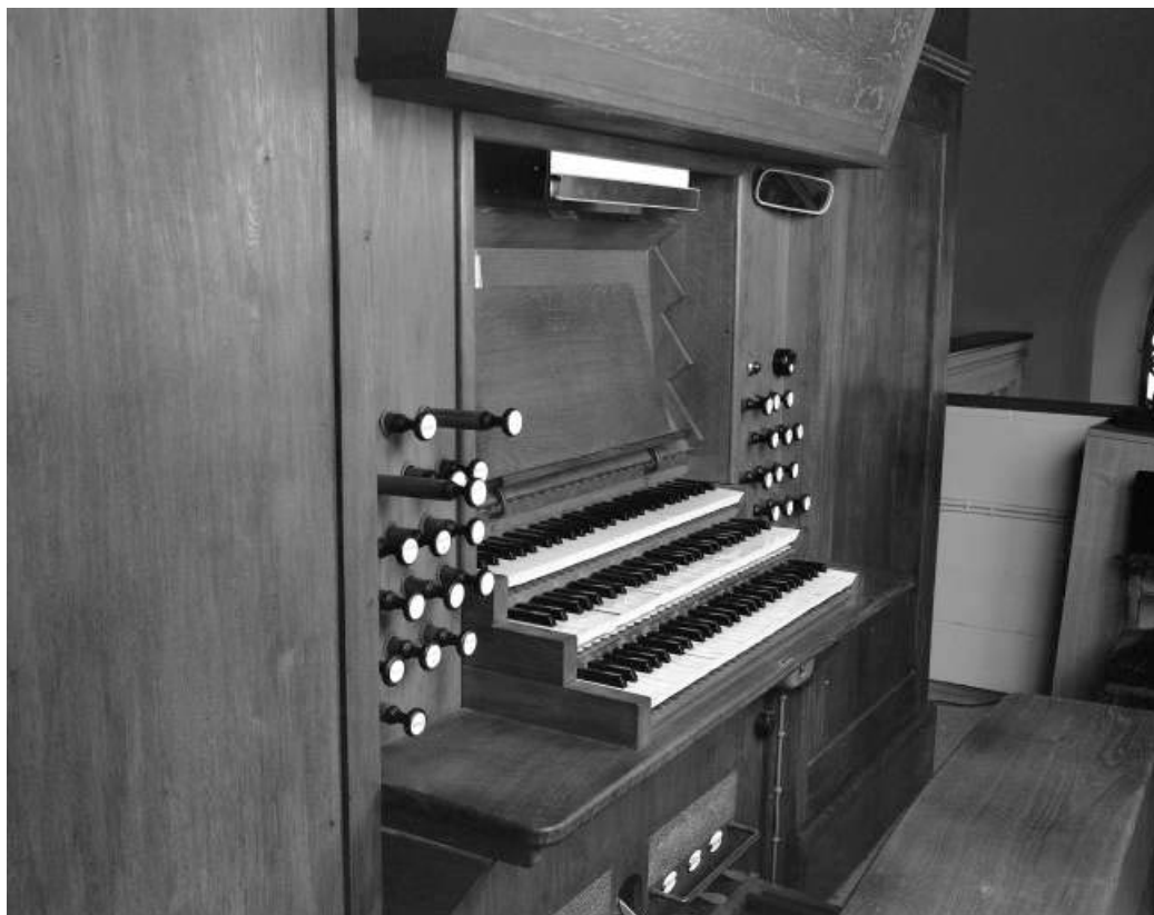
Console vue de trois quarts gauche.