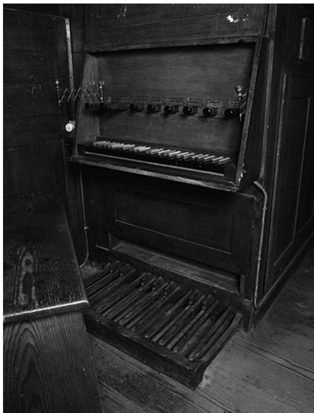
Console, vue en plongée de trois quarts gauche.