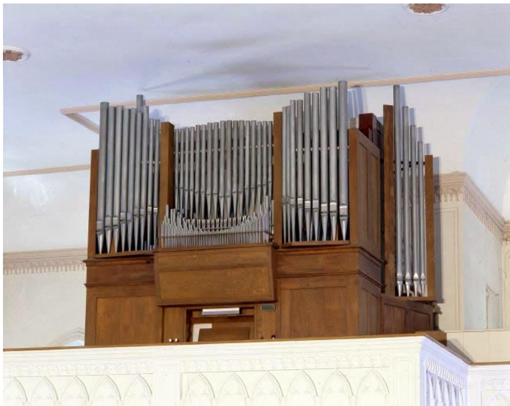
Vue générale de trois quarts droit.