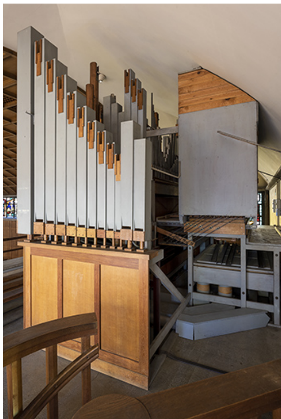
Vue de côté.