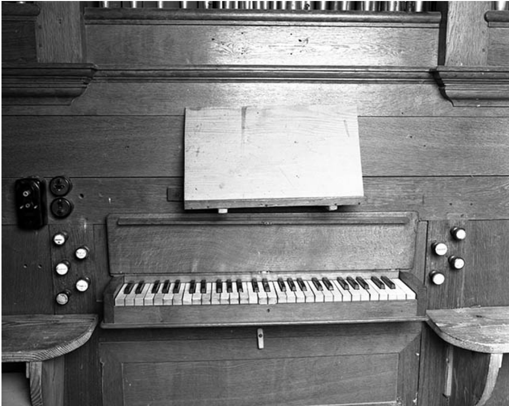
Console vue de face.