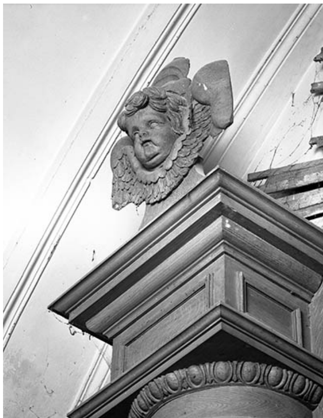
Couronnement de la tourelle gauche, angelot vu de trois quarts droit. 25, Quingey