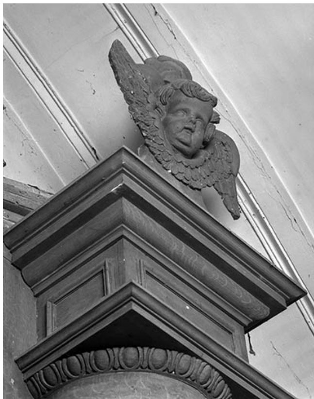
Couronnement de la tourelle droite, angelot vu de trois quarts gauche. 25, Quingey