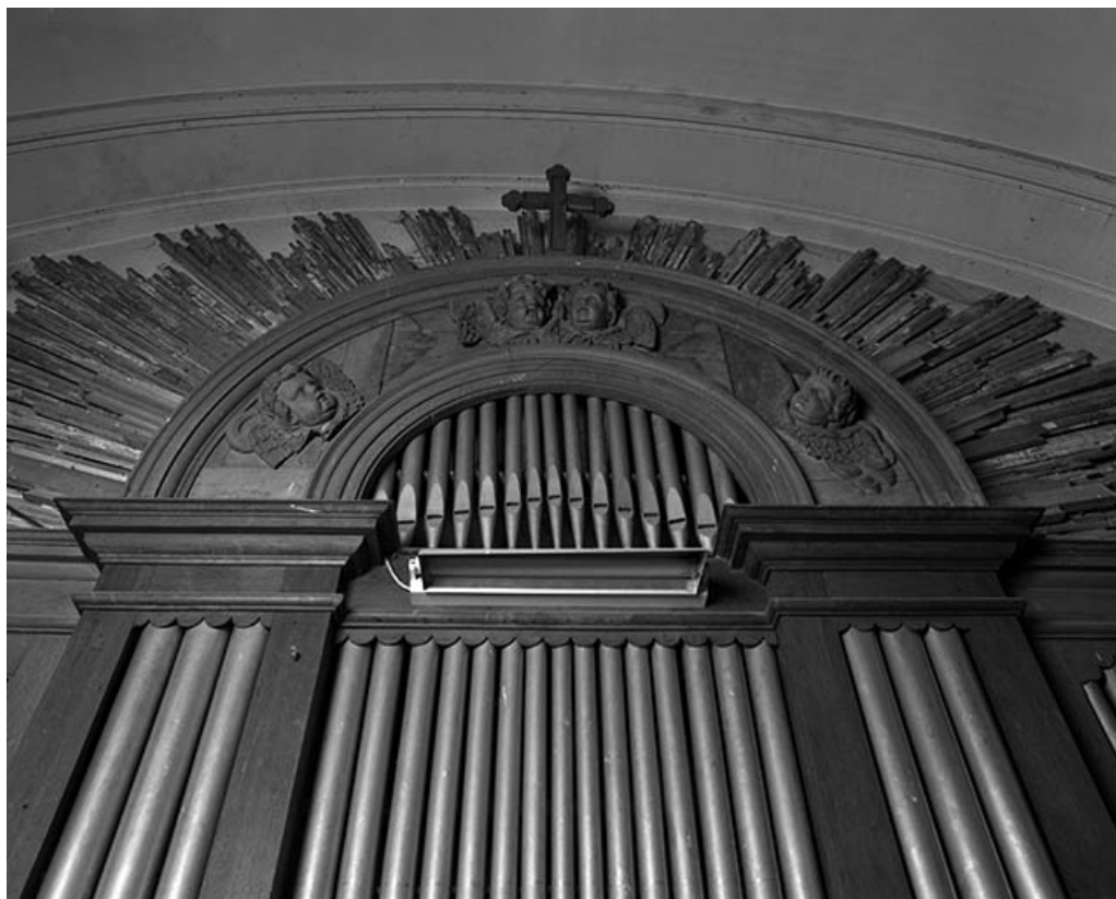
Couronnement vu en contre-plongée. 25, Quingey