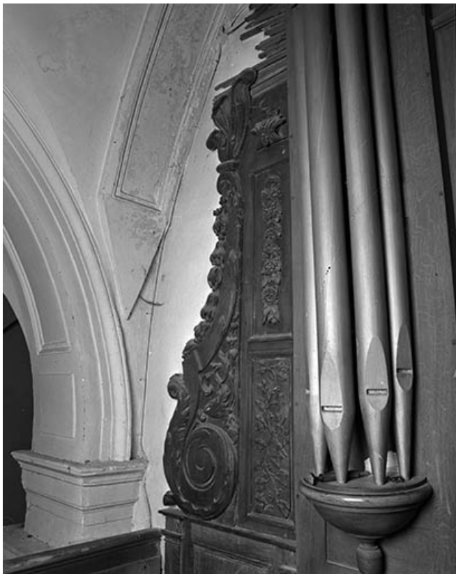
Aileron gauche vu de trois quarts droit. 25, Quingey