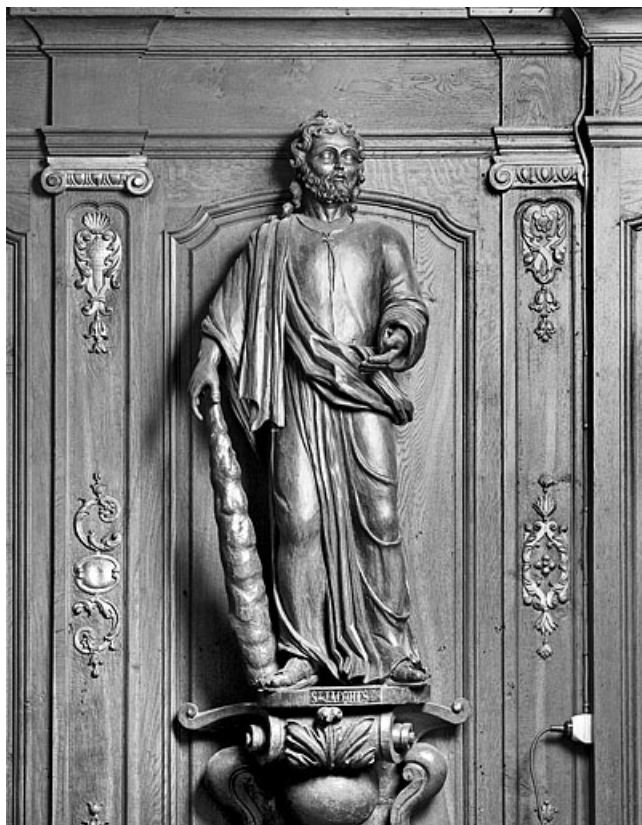
Saint Jacques le Majeur.

25, La Cluse-et-Mijoux, lieudit : le Frambourg