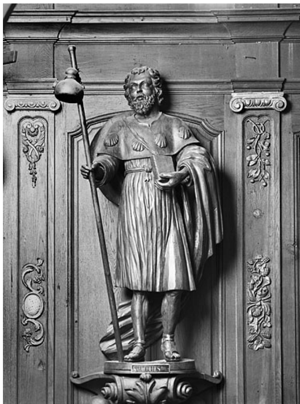
Saint Jacques le Majeur.

25, La Cluse-et-Mijoux, lieudit : le Frambourg