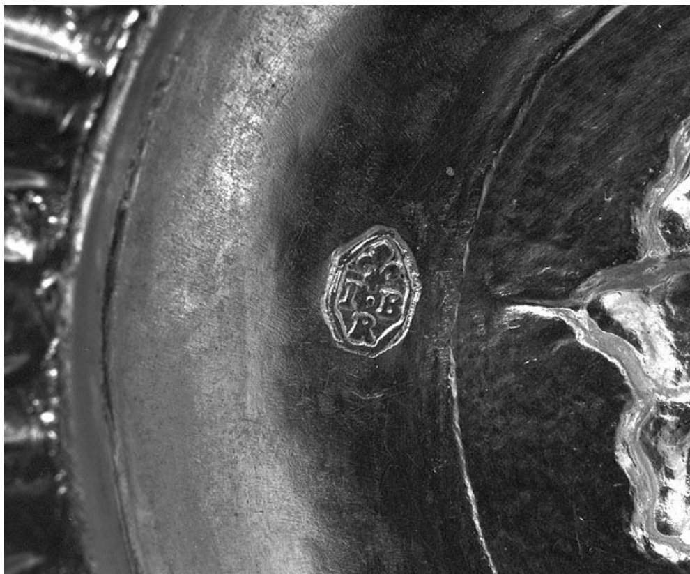
Détail : poinçon de maître. 25, Bouverans