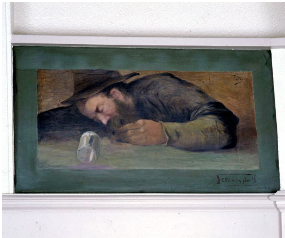
Effet de trop plein !, vue générale.