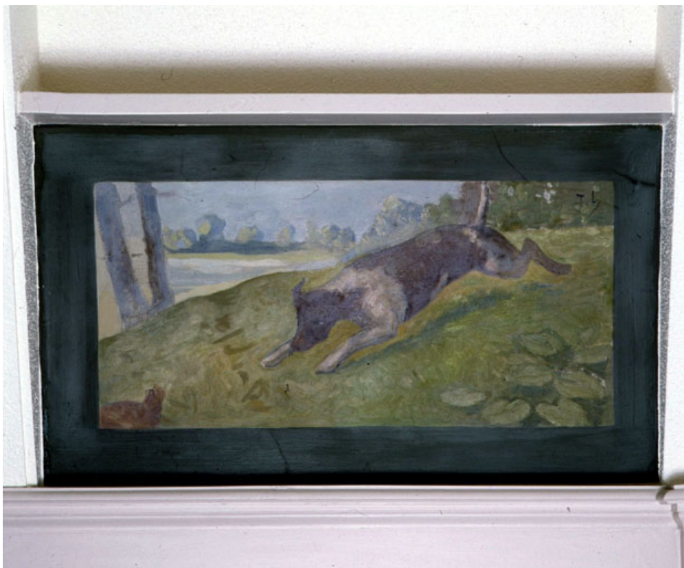
Chien poursuivant un animal, vue générale.