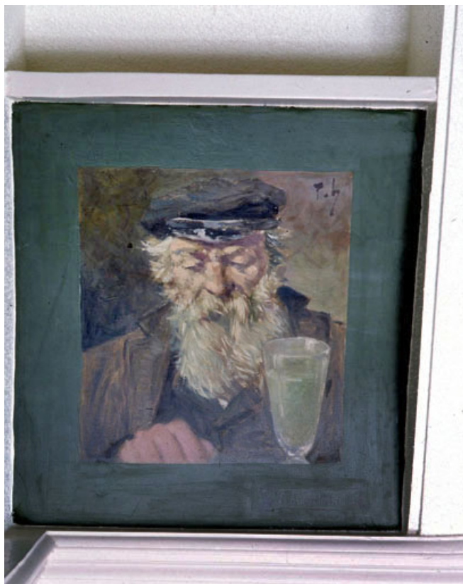
Via delirium tremens, vue générale.