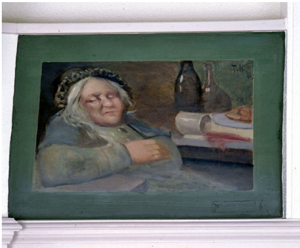
Hypnose vineuse I, vue générale.