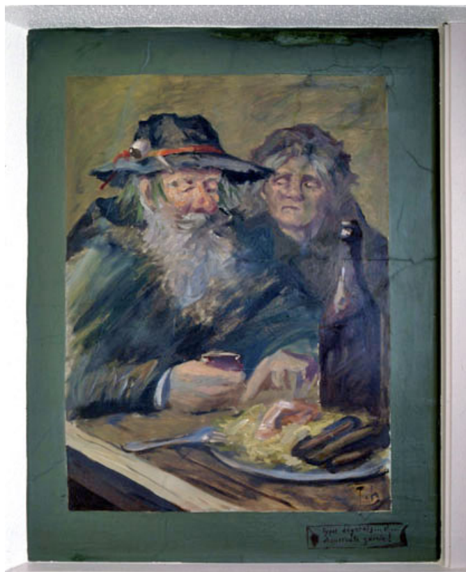
Types dégarnis...et...choucroute garnie !, vue générale.