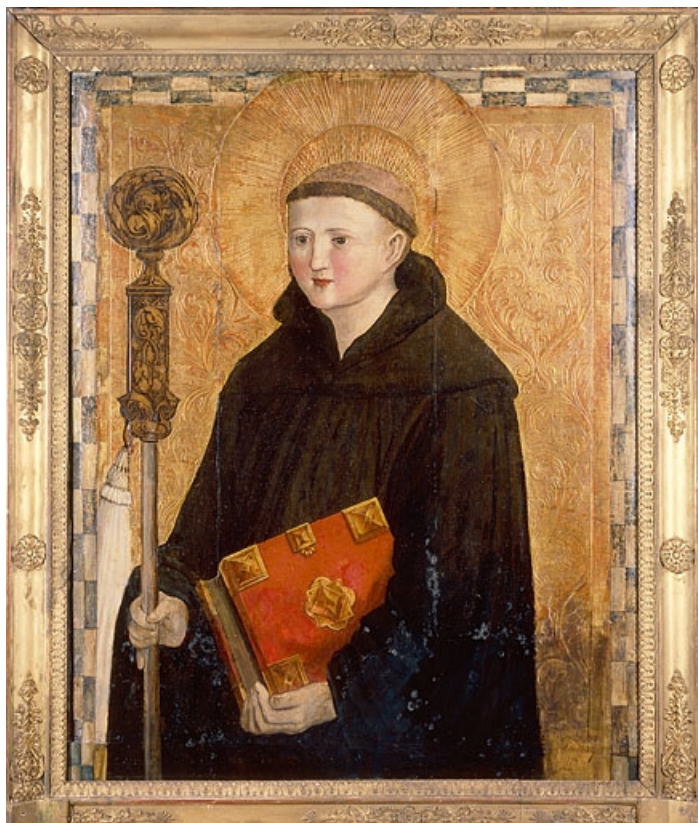
Saint Benoît. 25, Vuillafans