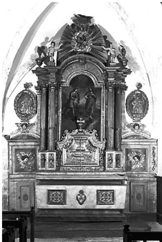
Vue d'ensemble du retable sud.